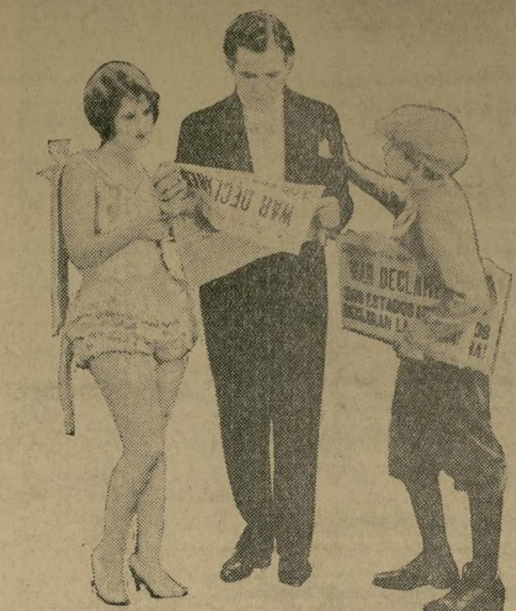
Una escena de la emocionante cinta hablada—en español—"Sombras de Gloria", exhibiéndose al presente en el "Fifth Avenue Theatre" del Harlem.

La atención del mundo teatral en Broadway se concentró anoche en el teatro de Miss Eva Le Gallienne en la calle 14, donde la joven y magnífica actriz sorprendió a sus admiradores con una poética y brillante concepción de la romántica heroína de Shakespeare en "Romeo y Julieta".