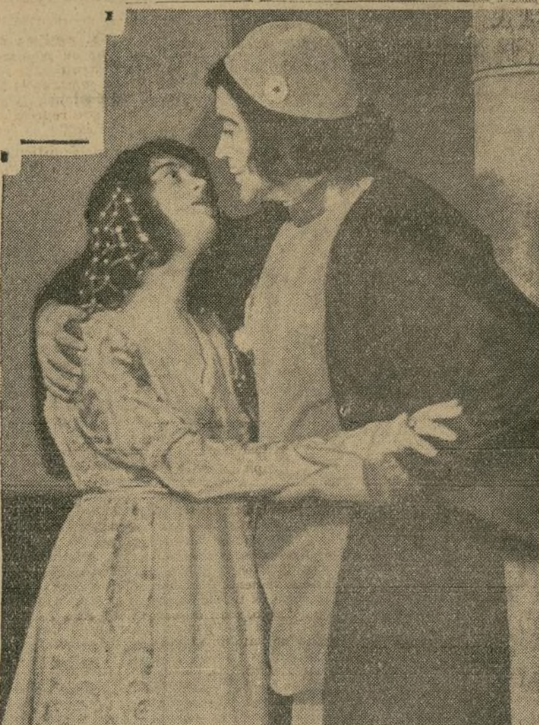
Georges Carpentier y Sally O'Neil en una escena de la comedia musical cinematográfica "Hold Everything", con la que se estrenó anoche aquí el teatro "Hollywood". ¿Quién iba a reconocer en el "niño bien" del grabado al que fue ídolo del "ring"?