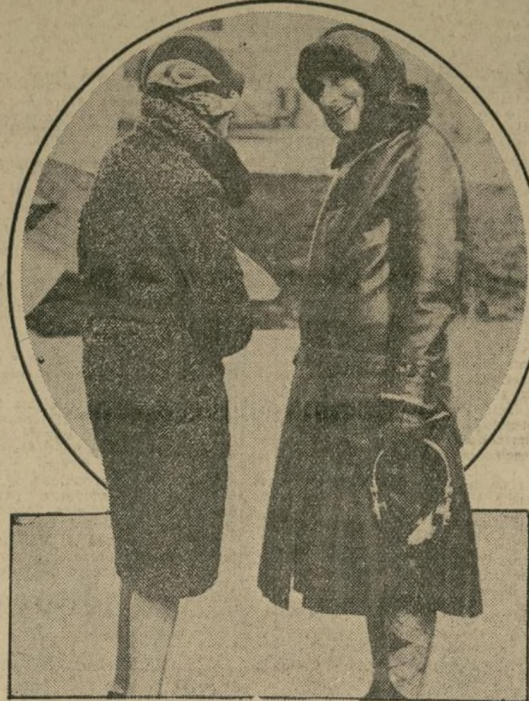
La duquesa de Bedford en compañía de la esposa del capitán Barnard, que va a ser su piloto y compañera de viaje en la gran gira aérea que la dama inglesa va a emprender al Sur de África.