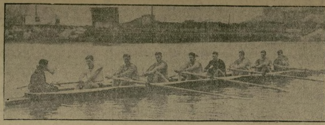
La tripulación "Varsity" de Columbia, entrenándose en el Hudson para las próximas regatas de Annapolis.