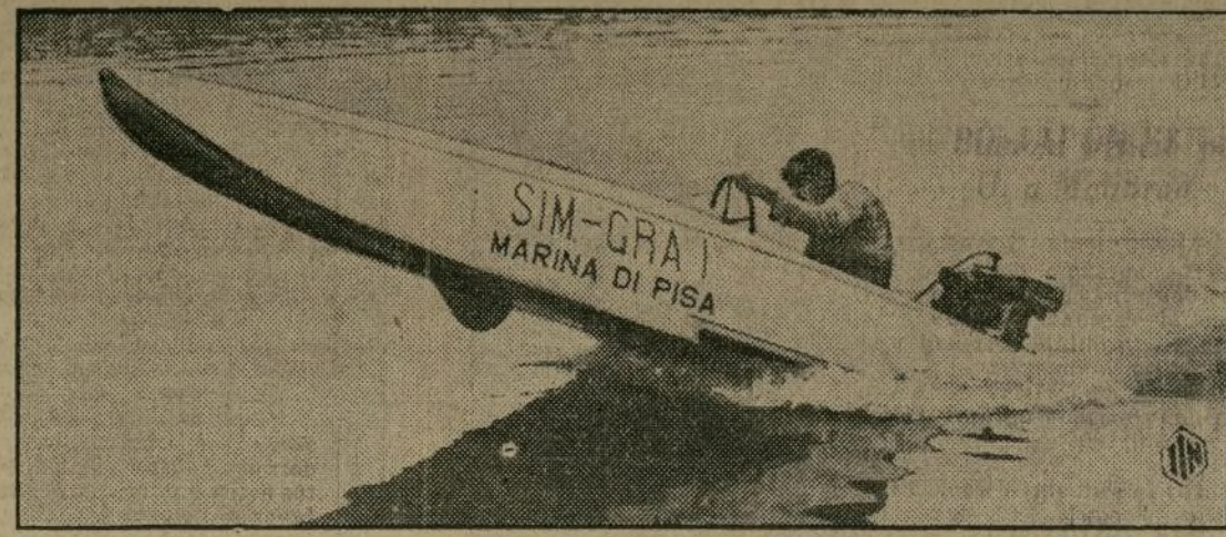
Considerada como una de las más veloces lanchas construidas recientemente, la "Marina di Pisa" se dispone a conquistar muchos laureles en las grandes regatas que se preparan para este verano.