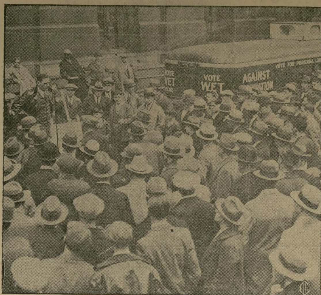
Multitud congregada en la plaza de Filadelfia despidiendo a un gigantesco autobús que con una colección de líderes políticos harán un recorrido en campaña por los "humedados."