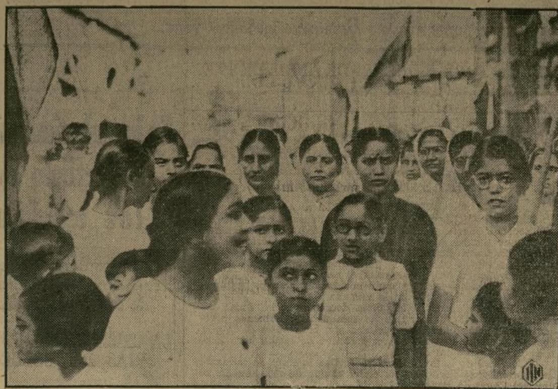
Muchachas de la India en manifestación por las calles de Bombay, secundando el movimiento independentista de Mahatma Gandhi. El gran líder de la India ha encontrado en el elemento femenino el apoyo más audaz y temerario. Muchas de estas muchachas han sido víctimas de sus ideas, pereciendo unas y resultando heridas otras.