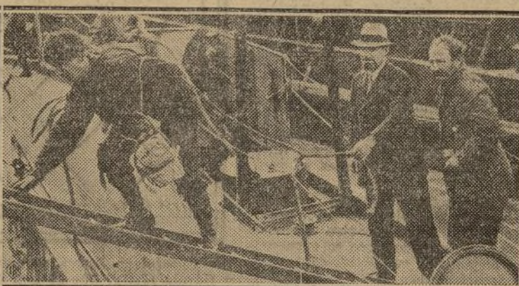
A su llegada a Irlanda con el "Nautilus," sir Hubert Wilkin aparece aquí ayudando a sus hombres enfermos a desembarcar mientras que él parece hallarse en la más perfecta salud.

Artículo 20.—Se prohíbe la entrada al país de los extranjeros siguientes: (a). Por razones étnicas: 1o. De los individuos de raza amarilla o mongólica; 2o. De los individuos de raza negra, salvo las es-