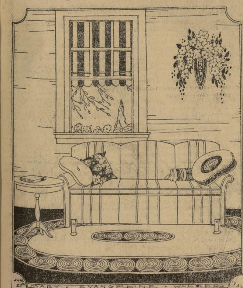
Un conjunto armonioso

de madera sobredorada, encierran unas flores pintadas al pastel. Este bien comprendido arreglo, produce un efecto sumamente decorativo, sin perder su gracia ligereza. Las cortinas de los ventanuales, serán de una cretona ramada, cuidando de que sus colores armonicen con los del canapé. Reemplazad con la imaginación este elegante conjunto por un macizo armario y comprenderéis desde luego la diferencia de valor artístico y decorativo de estas dos combinaciones.