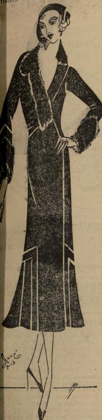
Arreglo de crepé de lana con cuello y puños de piel de oveja e incrustaciones