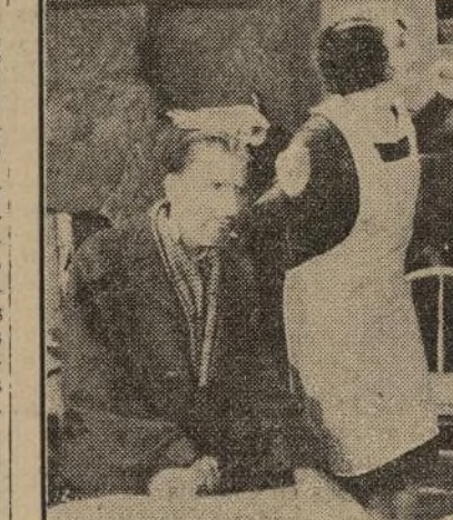
Un momento del drama cinematográfico, todo hablado en español, "Regeneración", que se empieza a exhibir en el "San José" el próximo viernes.