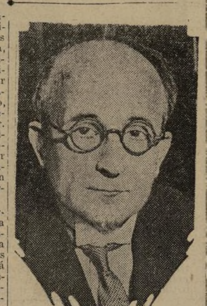
Señor Salvador de Madariaga