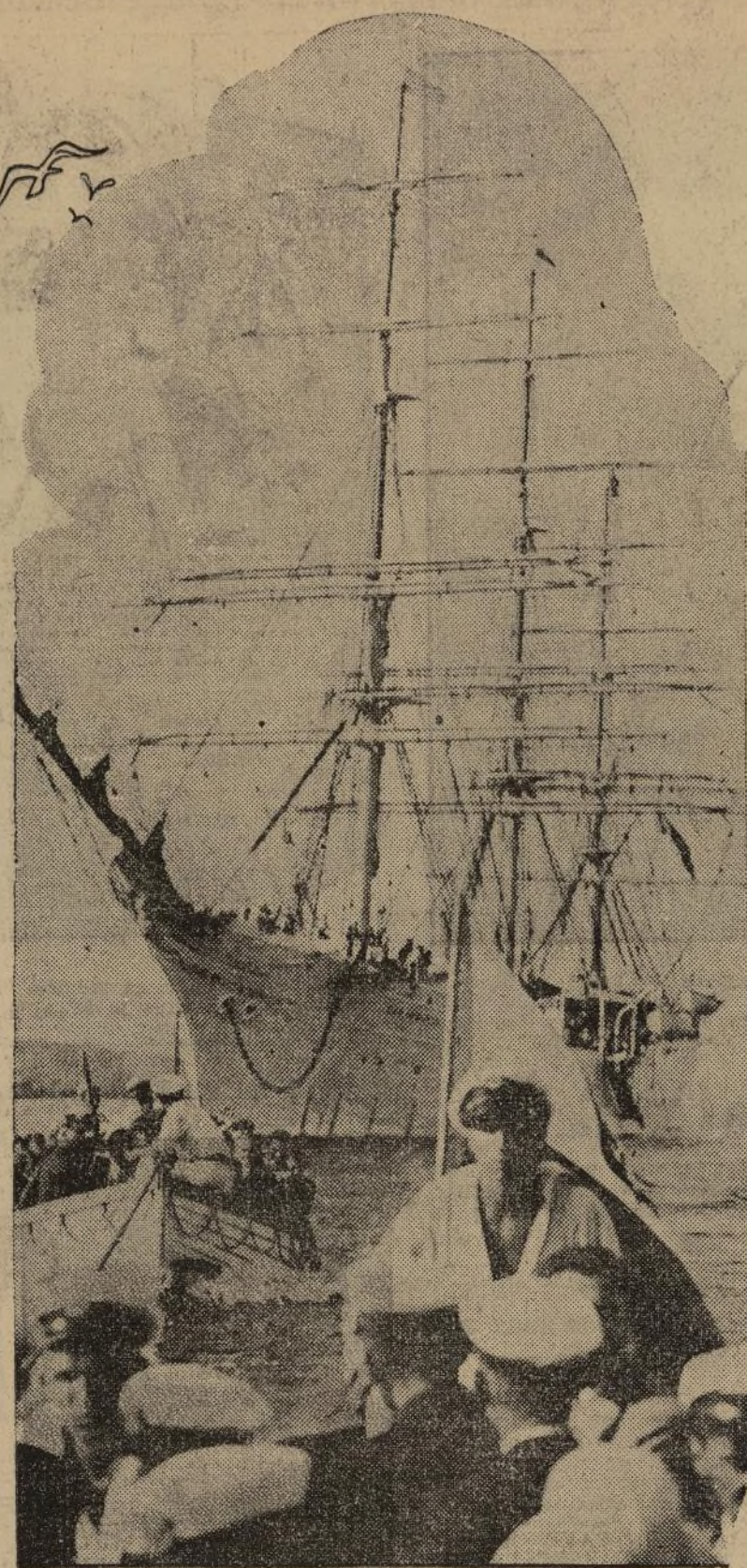
El barco escuela polaco "Dom Pomorza", que en estos días se halla anclado en el Hudson y que ha sido visitado por gran cantidad de ciudadanos de Polonia y americanos de dicho origen.