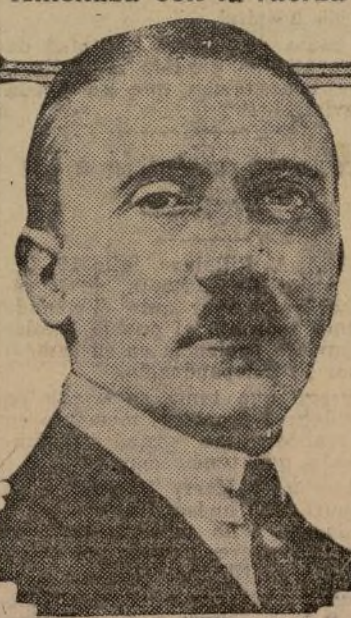
Adolfo Hitler, jefe de los fascistas alemanes, que recientemente declaró que estaba dispuesto a tomar el poder por la fuerza para salvar a su patria del peligro bolchevique.

Dice que el pueblo alemán está desesperado con su crisis financiera y que para salir de ella está dispuesto a hacer cualquier experimento en materia de gobierno.