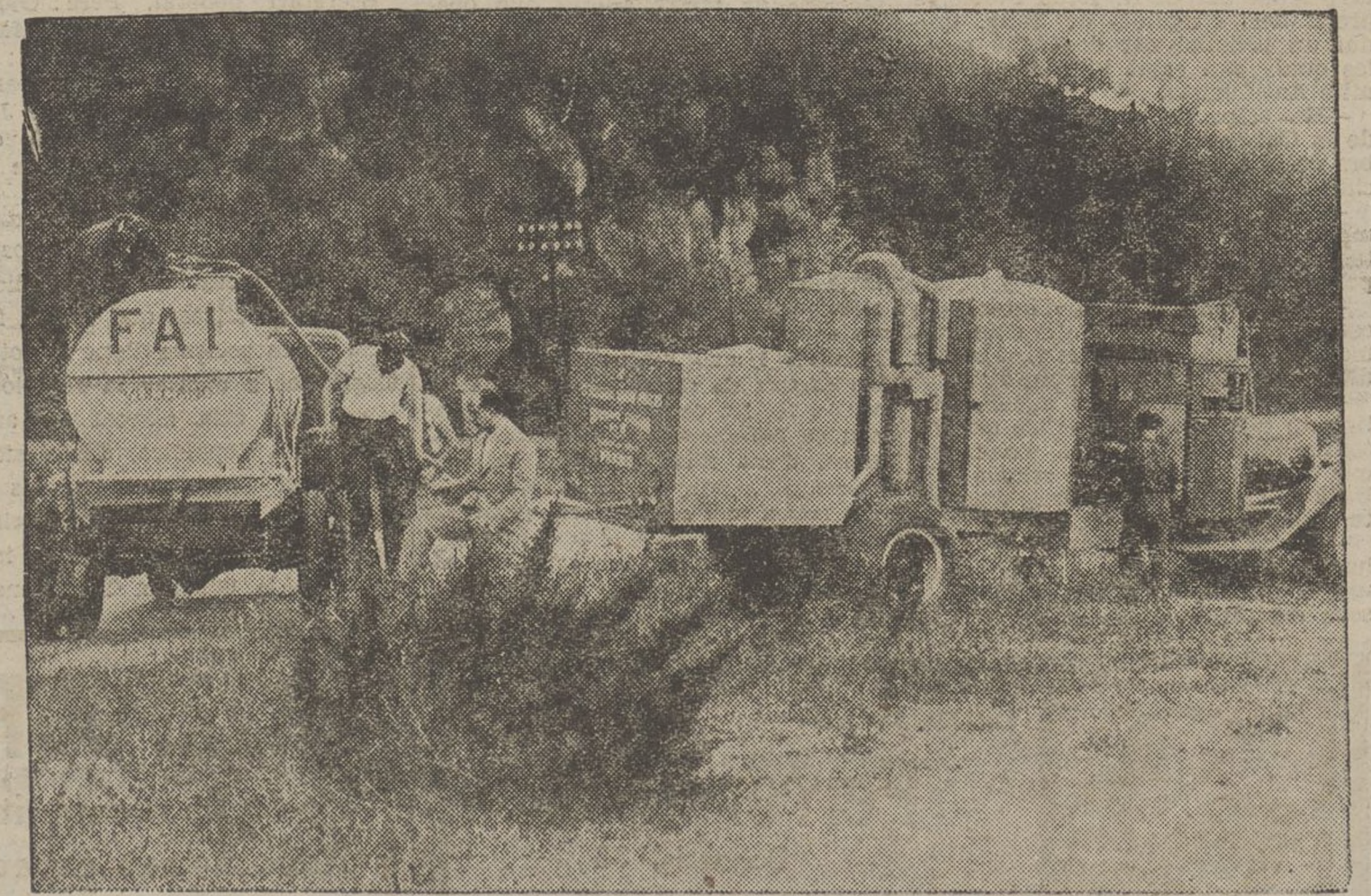
Una de les tasques més importants de la reraguarda és la que afecta el manteniment de la salut dels que lluiten al front de combat. No ha estat pas negligida aquesta preocupació al front català. El Consell sanitari del Comitè Central de les Milícies Populars, ha tingut cura no sols que no manqués res als hospitals, sinó que al front de combat fos vigilat l'estat sanitari adoptant les necessàries mesures de profilaxi i atenent la salubritat dels aliments i bogues. Heus ací una instal·lació depuradora de l'aigua. Aquest líquid, propagador de totes les malalties, arriba, per mitjà d'aquesta instal·lació, a la boca dels milicians en condicions perfectament asèptiques.