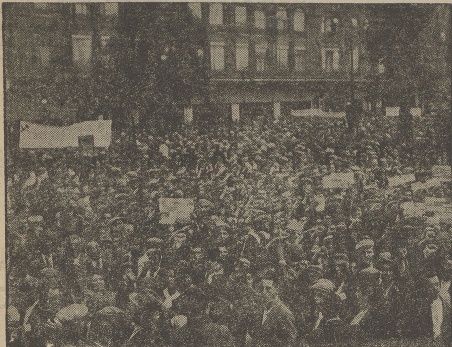
El poble parisenc es manifesta a favor dels que a Espanya lluiten en defensa de les institucions democràtiques contra un exercit traïdor i assassí. El bon poble de París, en una manifestació imponent, darrera una corona oferta als defensors de la República democràtica d'Espanya, reclama del seu Govern a favor del nostre, quelcom més que la simpatia platònica que ha demostrat.