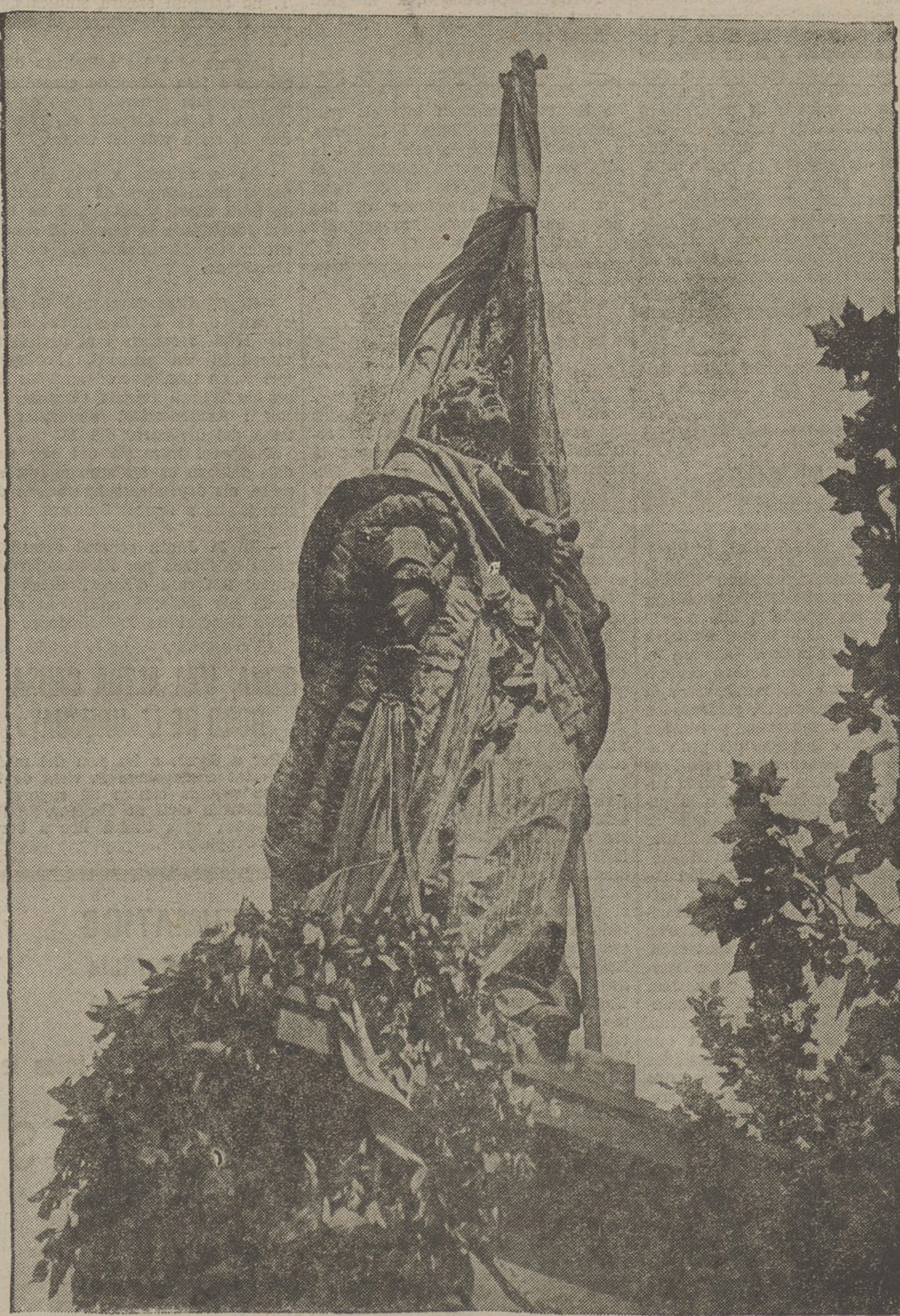
El statu de Rafael Casanova, al monument de la Ronda de Sant Pere. En aquest onze de setembre, s'ha cobert de flors. Banderes de combat de les forces que lluiten per la llibertat rememoraran avui, envoltant la simbòlica figura, aquell esperit d'independència que reviu a avui amb trets vigorosos en el nostre poble.