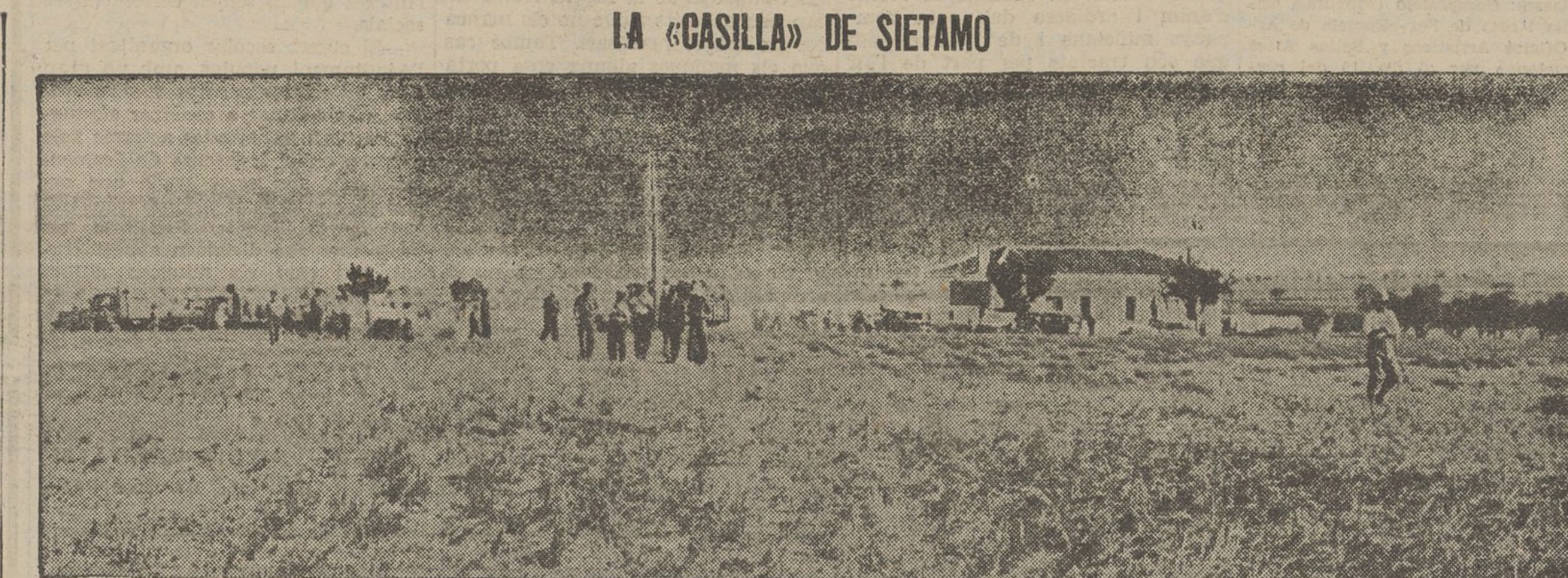
A tres quilòmetres de Sietamo i a 15 d'Osca, hi ha la caseta de caminers de la carretera d'Osca a Farbastró, que ha estat quarter general de les forces lleials i cap d'operacions que ha vist cent combats.

Un altre amic ens escriu que en alguns poblets provenen de l'oci en què viu el Comitè local. «Si