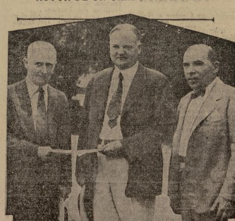
GEORGE M. COHAN, conocido músico y artista de Nueva York (izquierda), presentando al presidente Mr. Hoover el original de un canto patriótico que acaba de componer y que se titula "Padre de la Tierra que Amamos", hecho en honor de Washington. El congresista Sol Bloom, a la derecha, contempla la entrega.