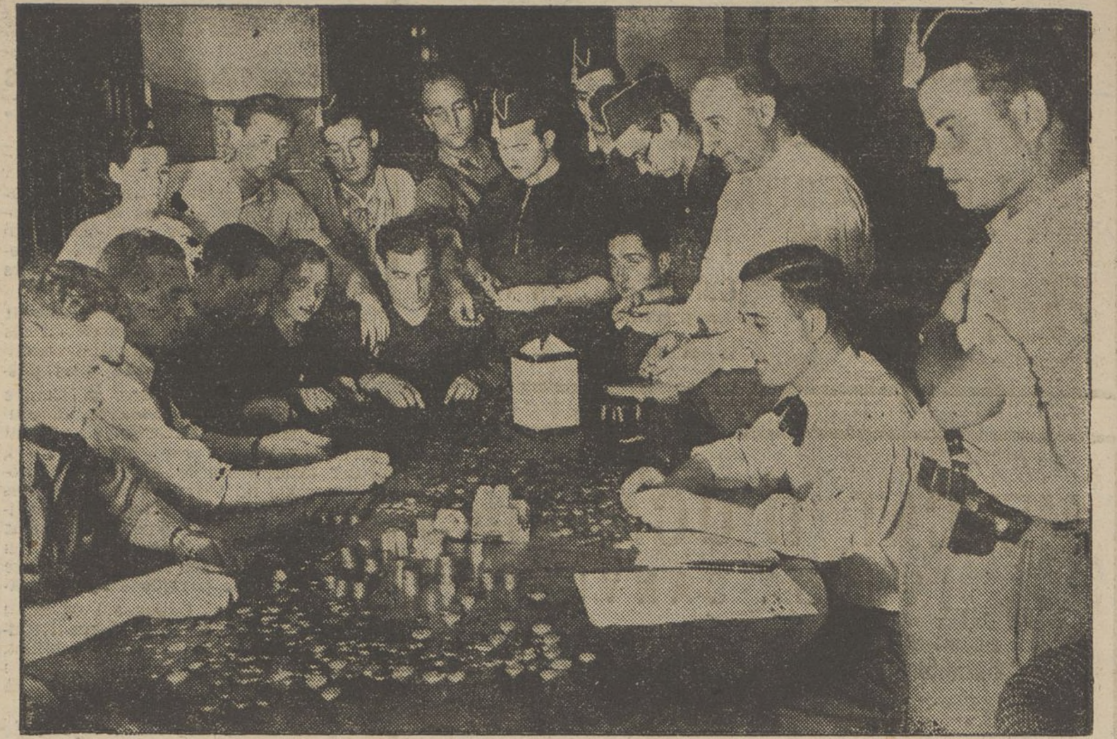
En la festa de l'onze de setembre i en als actes esportius de diumenge, es feren grans recaptes a benefici de les milícies i de les víctimes ocasionades pel moviment facciós. Aquells dies, el Comitè de Milícies hi ha hagut feina intensa a comptar els diners que la voluntat popular ha donat per a la lluita contra el militarisme assassí.

I els camperols d'Andalusia, d'Extremadura i de la Manxa, anaven deixant la carn a trossos damunt la desolada estepa castellana.