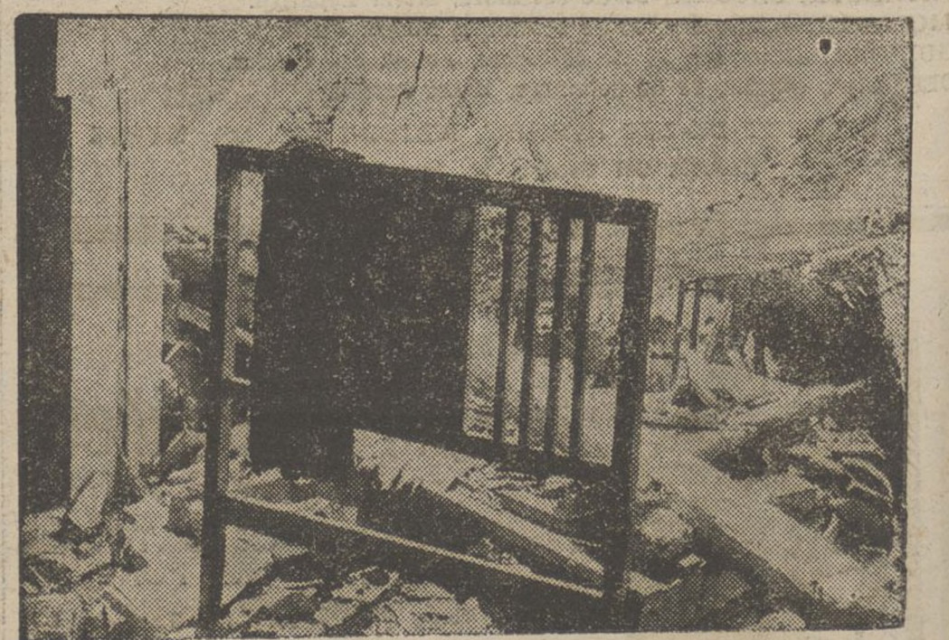
Després de vora un mes de lluita en la qual el poble de Sietamo ha estat objecte de persistents bombardeigs per una i altra banda, pot dir-se que no ha quedat als edificis del poble pedra sobre pedra. Veieu a la foto com ha quedat una casa després del bombardeig.