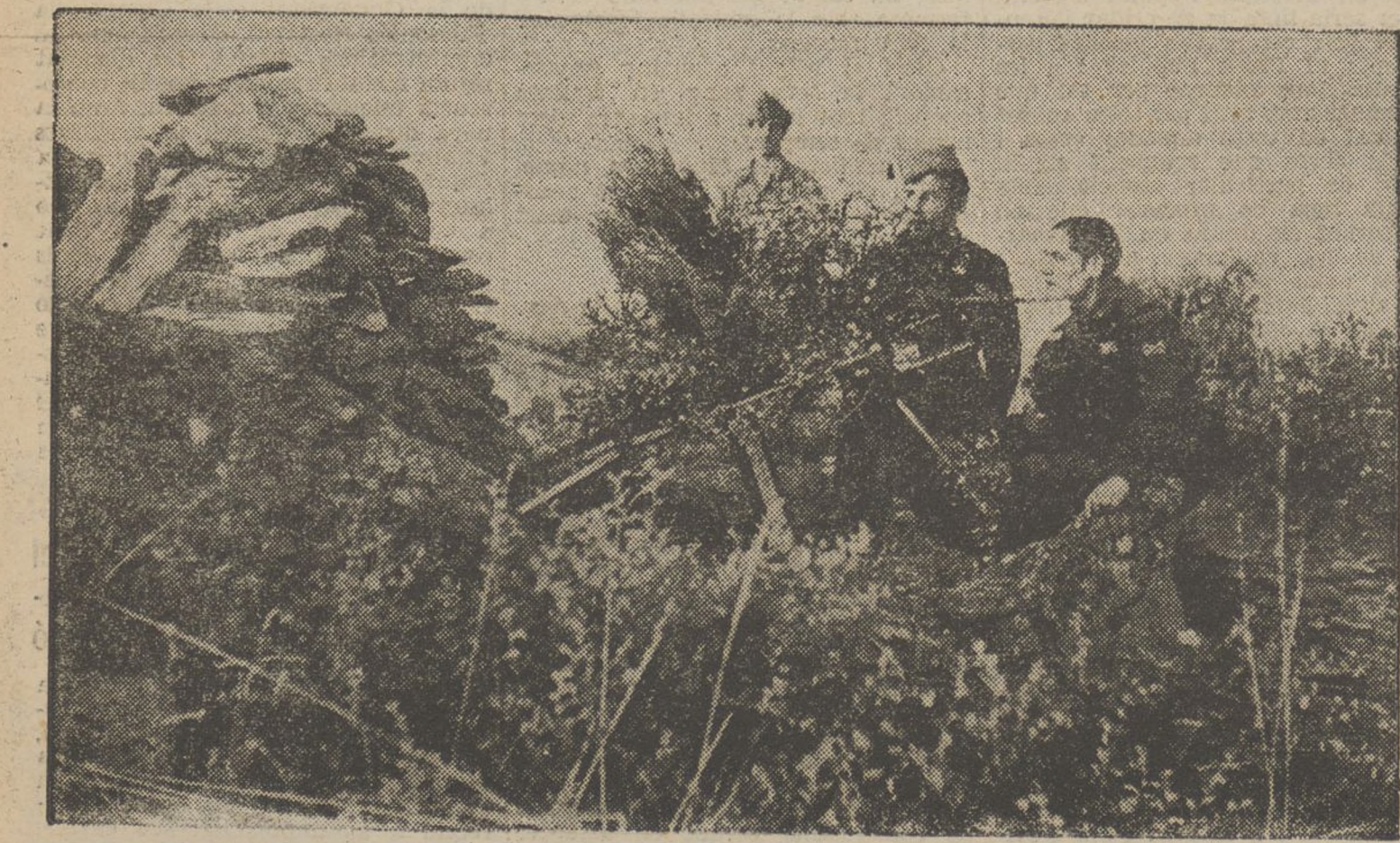
Una avançadeta en un lloc d'observació. Pel que pugui passar, porta una metralladora preparada.