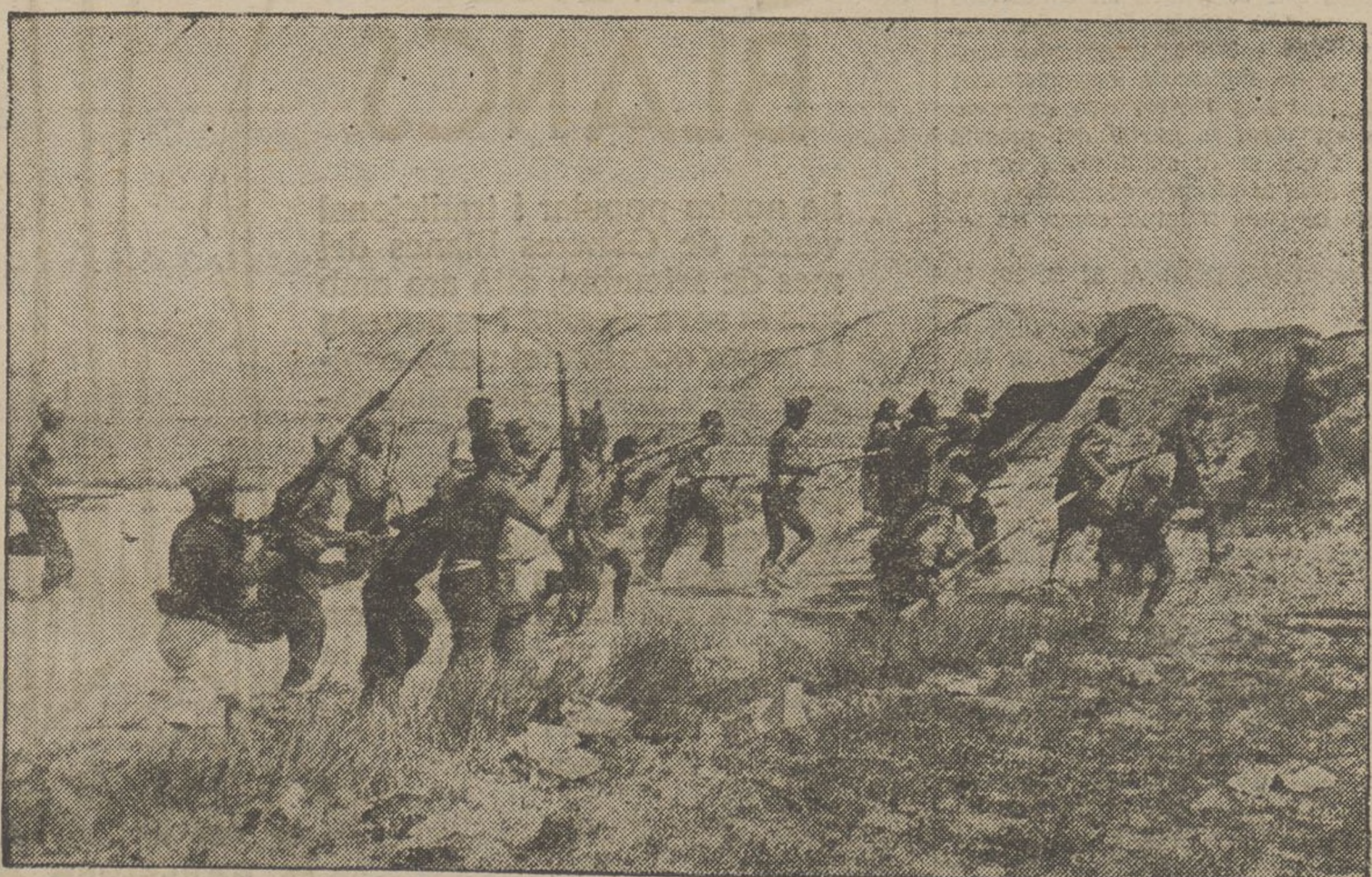
La configuració topogràfica del terreny al sector sud del front d'Aragó, és prèstia a les operacions de guerrilles per a la realització d'objectius locals. L'ardidesa dels nostres guerrillers, en tot moment demostrada, es posa prova en anar a prendre una nova posició.

Hom li ha preguntat si seria ell, a la qual cosa ha contestat negativament, i ha dit que probablement el designat seria el senyor Irujo.