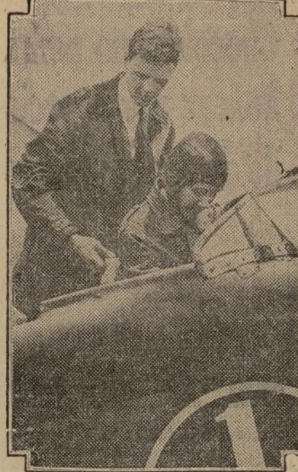
A la izquierda aparece el coronel Charles A. Lindbergh dando lecciones a su novel esposa en el arte de volar. Cuando ambos se casaron en mayo de 1929, todo el mundo creyó que Anne haría que su esposo abandonara la aviación, pero todo el mundo estaba equivocado, pues la joven señora no sólo no hizo que Lindbergh abandonara la aviación, sino que ella misma se hizo una experta aviadora y antes de cumplirse el primer año de la boda Anna ya tenía su licencia de piloto y había visto desde el aire más mundo que mujer otra alguna.