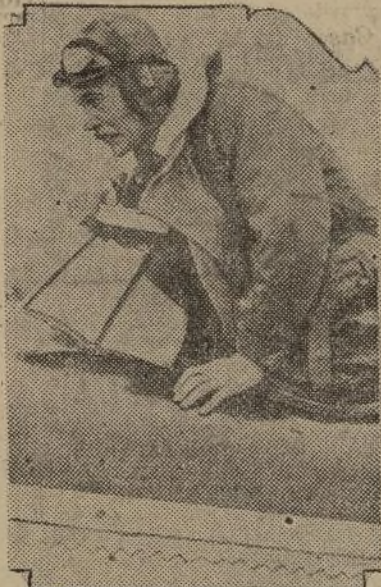
VUELVE A SU PATRIA. —El primer ministro inglés Ramsay McDonald bajándose del aeroplano que lo llevó a Londres de regreso de su viaje a Berlín.