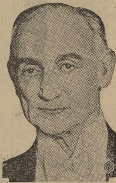
LORD READING, que fué embajador inglés en los Estados Unidos y virrey de la India, que acaba de dar una sensación en Londres diciendo que se casa con su secretaria, de 37 años de edad. El señor quedó viudo hace un año; un caso de reincidencia como muchos que se dan.