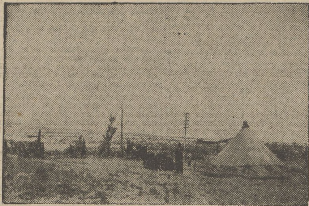
Un dels campaments de la columna Durruti