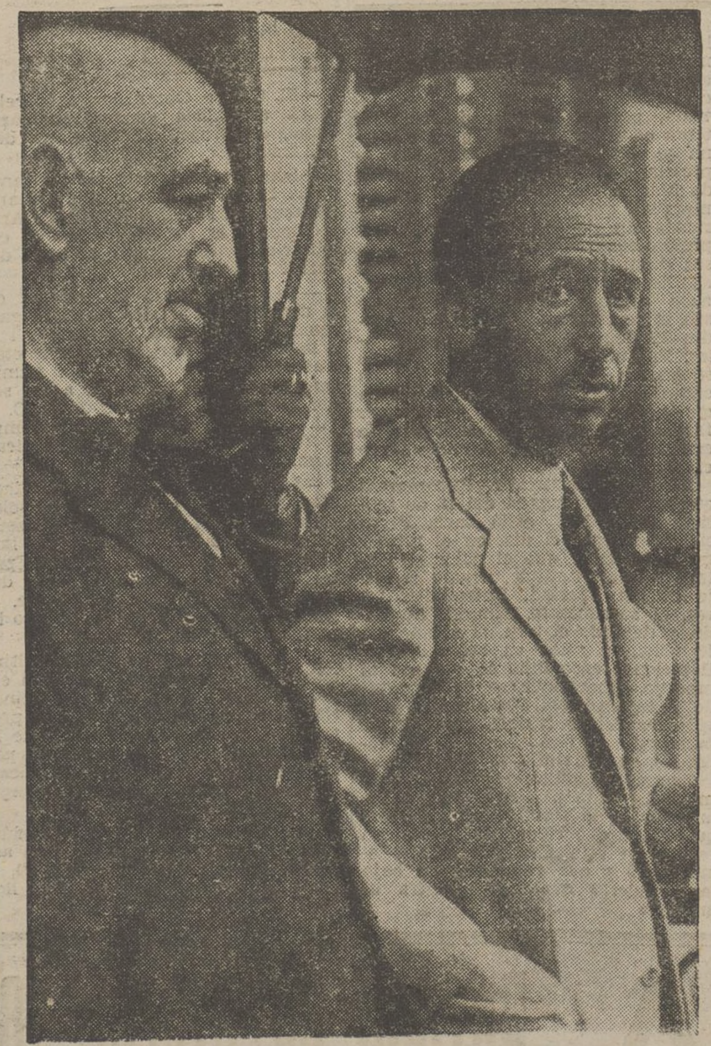
El President Companys, amb el seu hoste il·lustre, el senyor Ossorio i Gallardo, s'adhereix al dol presenciant el pas del següent dels del balcó central del Palau de la Generalitat