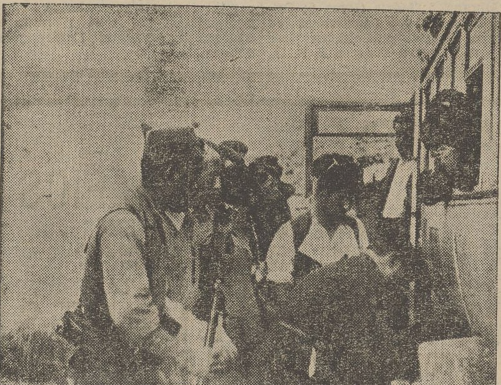
Un dels vehicles en els quals són traslladats els delictes del Manicomi d'Oscà, ha tingut una «parada» de pneumàtic. L'inspector de Sanitat del Front d'Aragó, que dirigeix l'expedició, ajuda personalment a reparar l'avaria.