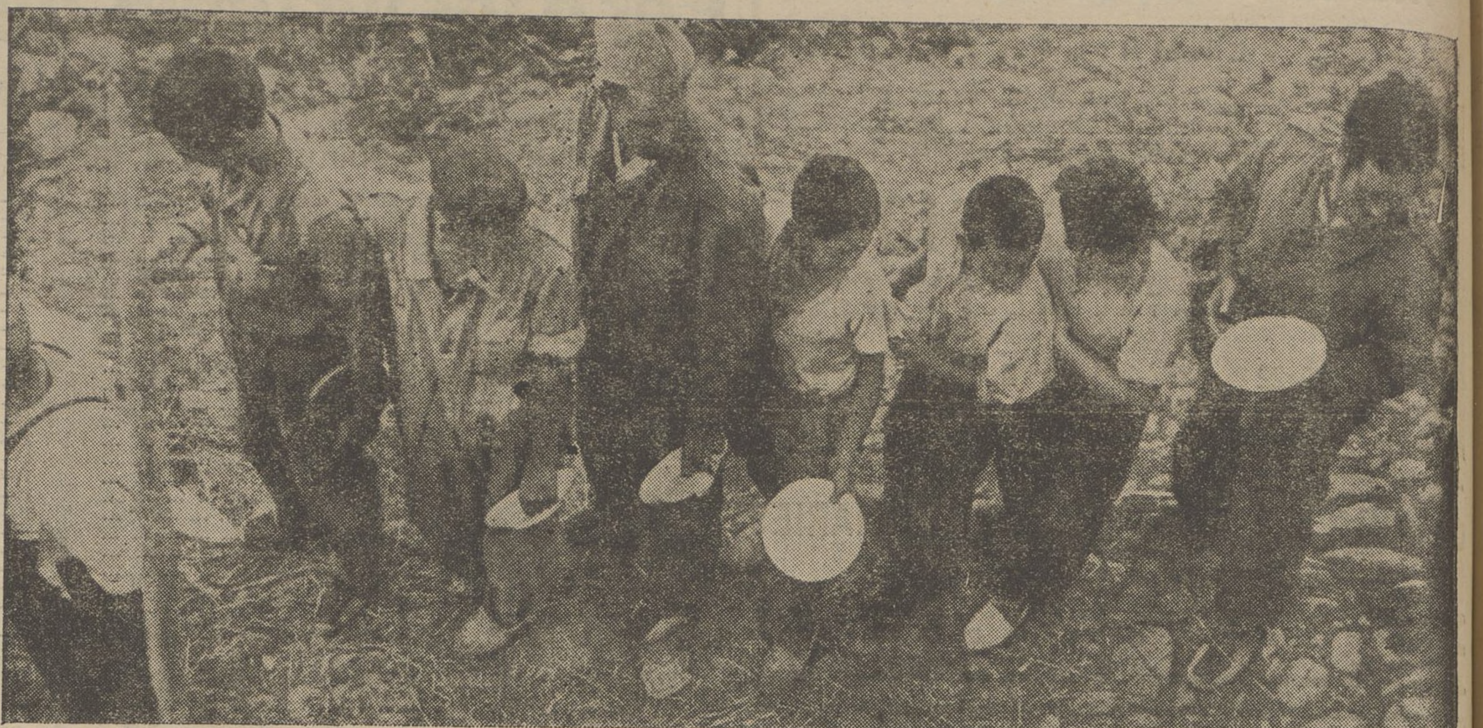
Les nostres forces, alliberadores del jou feixista als pobles d'Aragó, no han limitat a això la seva tasca benefactora. Expoliats els habitants per les hordes faccioses, la fam hauria fet presa en aquells senzills habitants si les milícies populars no compartissin amb ells el pa i la sal.