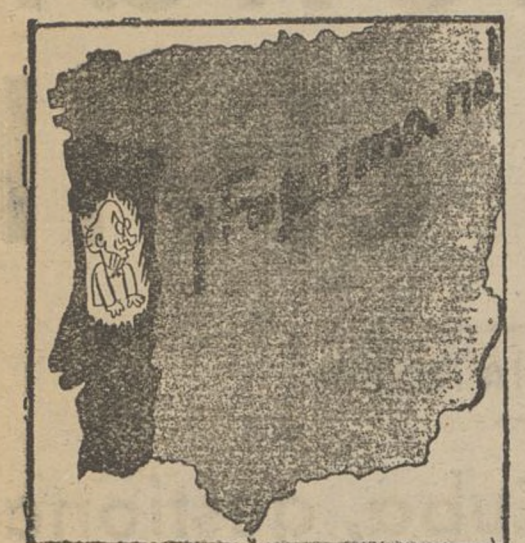
«EL GRAN CANALLA HABLA» (De una carta de Llorca.) «O laboro con la razón, con la justicia de la civilización y el progreso.» «Yo prefiero mil veces la dictadura de de reñías.» Comentario. — Toda una vida al servicio de la traición. (De «Claridad»)