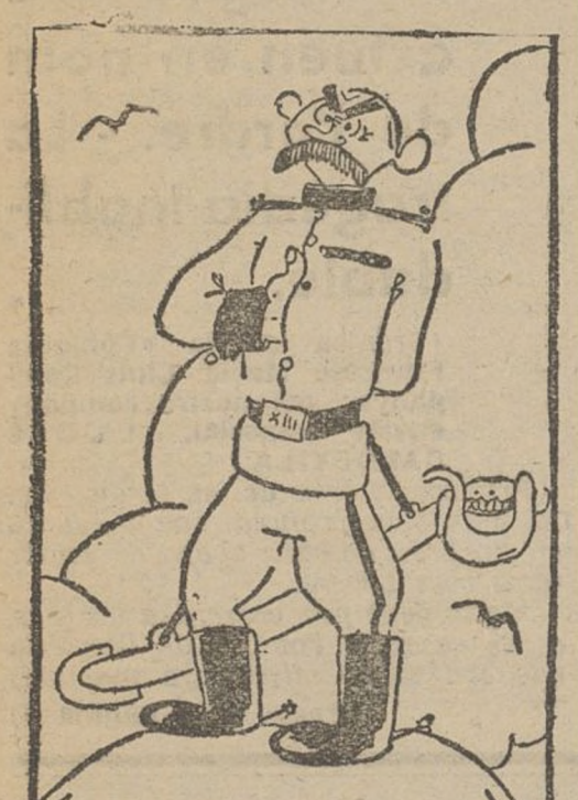
«EL AMOR» A LA PATRIA —Si se me acaban los moros traeré a los zulúes, y si no a los hotentotes y a los cafres. ¡Hay que salvar a la patria de la barbarie marxista! (De «Heraldo de Madrid»)