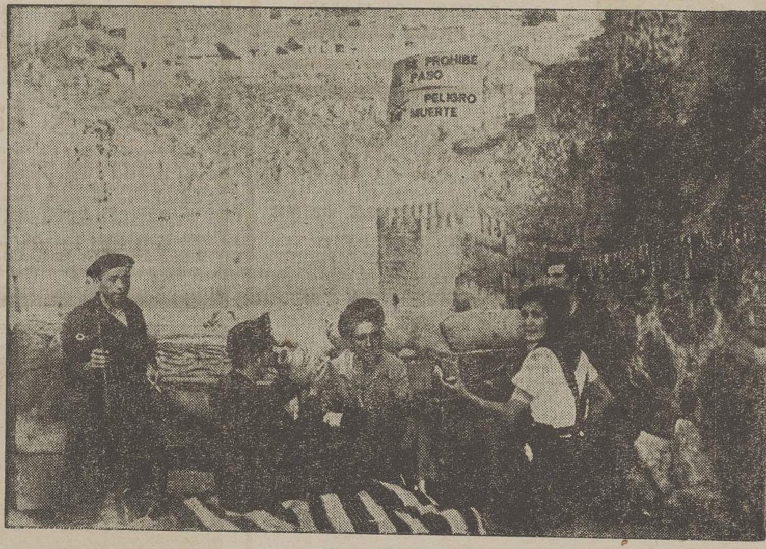
El seige a l'Aloàser de Toledo ha posat a prova la paciència de les milícies populars pel seu afany humanitari d'estalviar víctimes innocents. Ells es juguen la vida; però no volen que la perdin els que no són bel·ligerants. Aquest rètol n'és una prova irrefutable