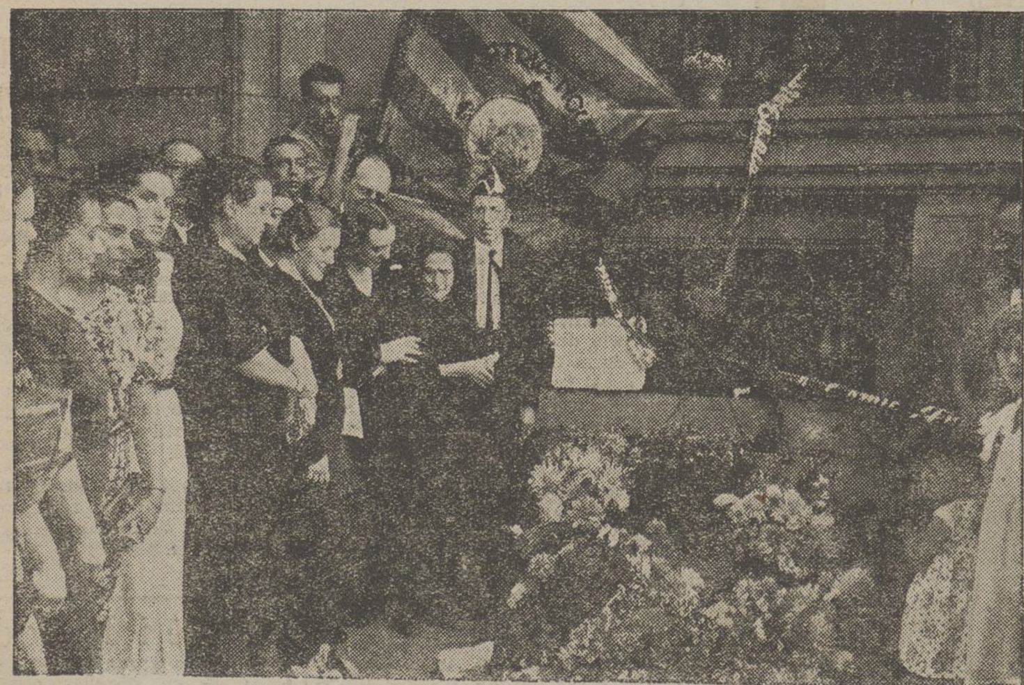
Una nombrosa munit de patriotes catalans, a iniciativa de la Joventut d'Esquerra Nacionalista, «Pàtria Nova», ofrenà diuenge ramells de flors a la memòria dels Colldeforns al lloc on calgueren ferits de mort per les bales de la traïció militar facciosa