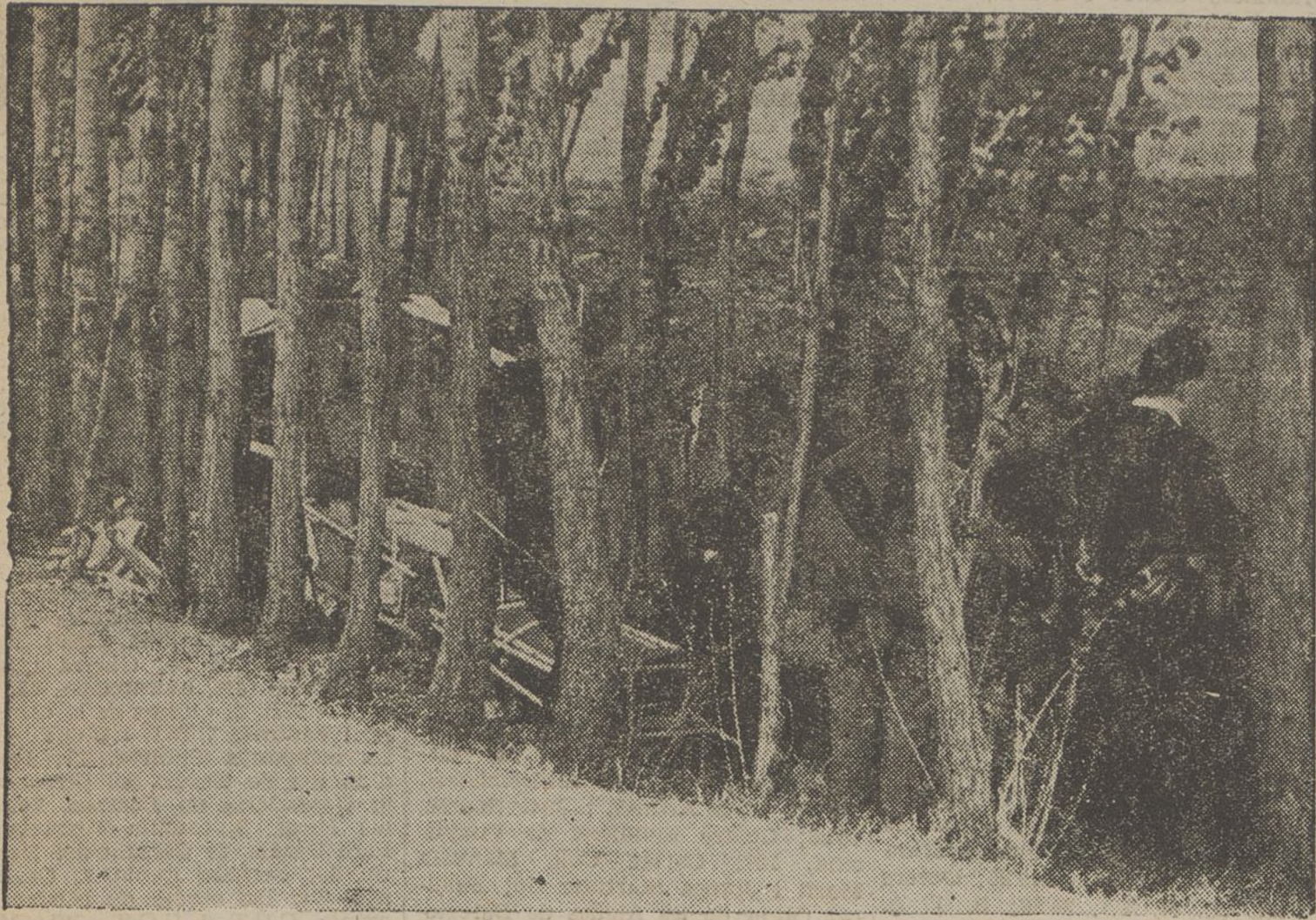
En les milícies populars el servei sanitari no està mai desatès. S'ompra pels defensors de la República i fins pels seus enemics que cauen en la lluita. Cal, però, que els nostres sanitaris es posin a cobert de les malvestats dels enemics que no respecten ambulàncies de la Creu Roja ni serveis d'auxili de cap mena