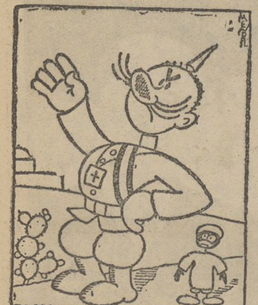
«EN MARRUECOS» —¡Aquí no hay más rifleño que yo! (De «El Liberal»)