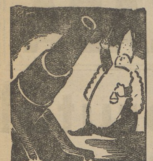
«Yo te bendigo, en el nombre del padre...» (De «C. N. T.»)

PREUS DE SUBSCRIPCIÓ: Barcelona, un any 450 pts. Fora, un trimestre 1050 » Amèrica Llatina (Portugal) un trimestre 13- » Altres països, un trimestre 27- »