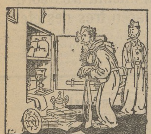
«LOS REGISTROS ECLESIASTICOS» —¡Atiza! Oro, plata, valores, joyas, acciones, piedras preciosas, billetes, millones... ¡y el copón! (De «La Voz»)