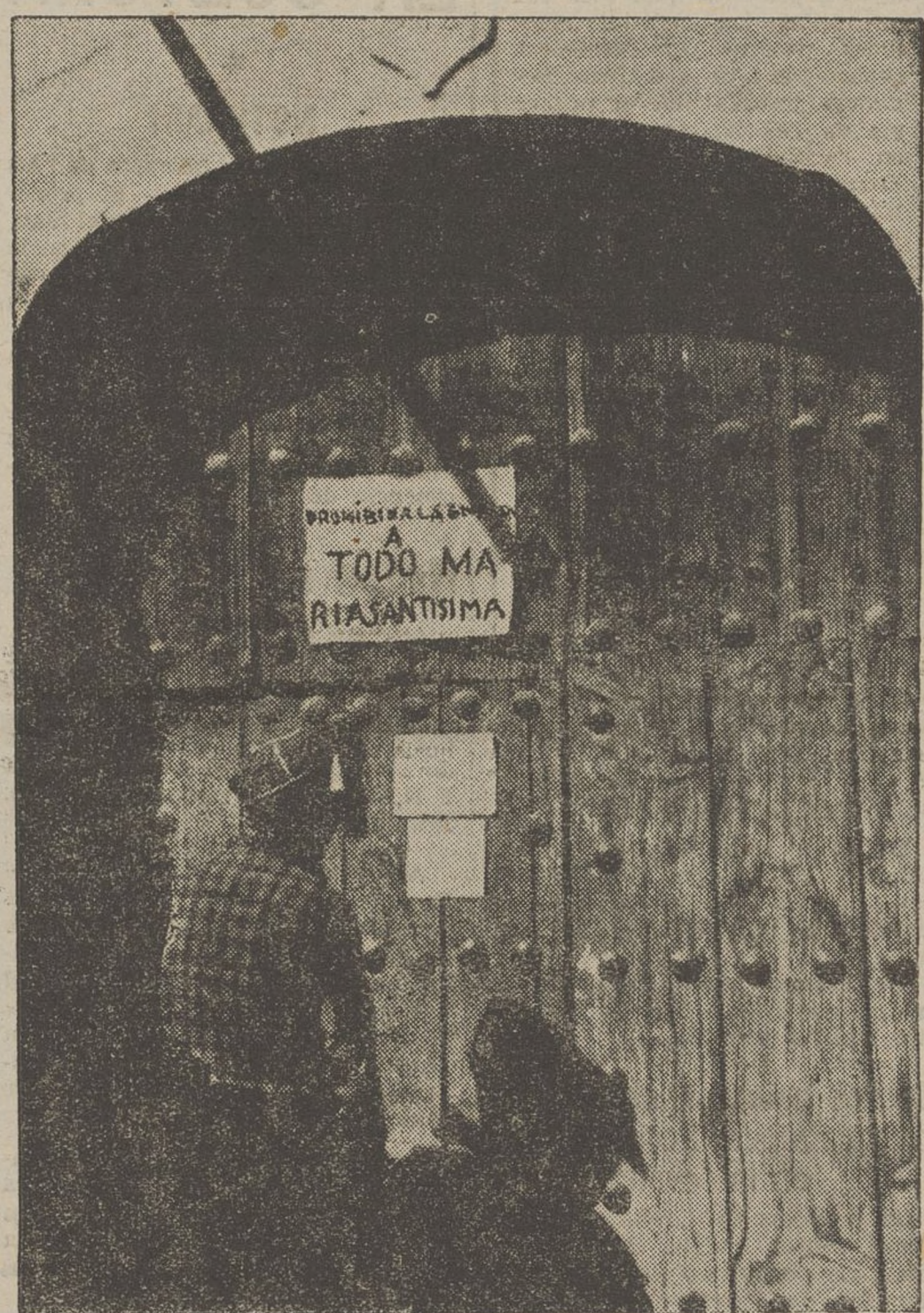
Les milícies populars al front aragonès han muntat els serveis de vigilància i de control a la roguarda amb tota cura i amb tota serietat. Hous act una oficina de milícies: «Prohibida la entrada a toda Maria Santísima». Sembla una frase d'humor. No ho és. No vol dir en l'heugantse baturro sinó que la consigna no es crebanta per res ni per ningú.