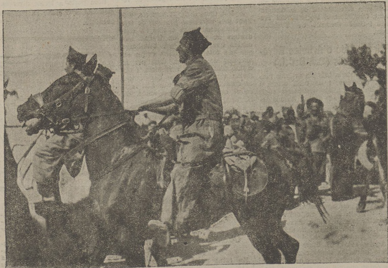
Fa uns dies fou copat per les nostres milícies un esquadró de cavalleria del regiment de Castillejos, procedent de Saragossa. La foto reproduïx una escena de l'arribada dels soldats presoners a la caserna general de les milícies