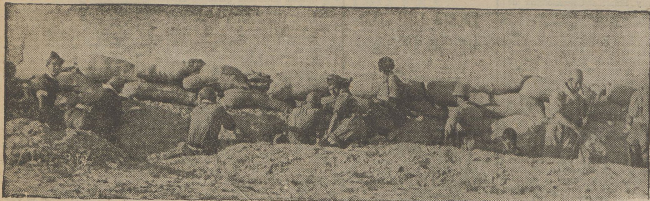
Cal consolidar els avanços obtinguts a costa de lluites molt asfíctiques. Allà on la trinxera es fa difícil, es basteix el «bloc», mur que es fa de pressa i que resulta molt eficaç per a la defensa.