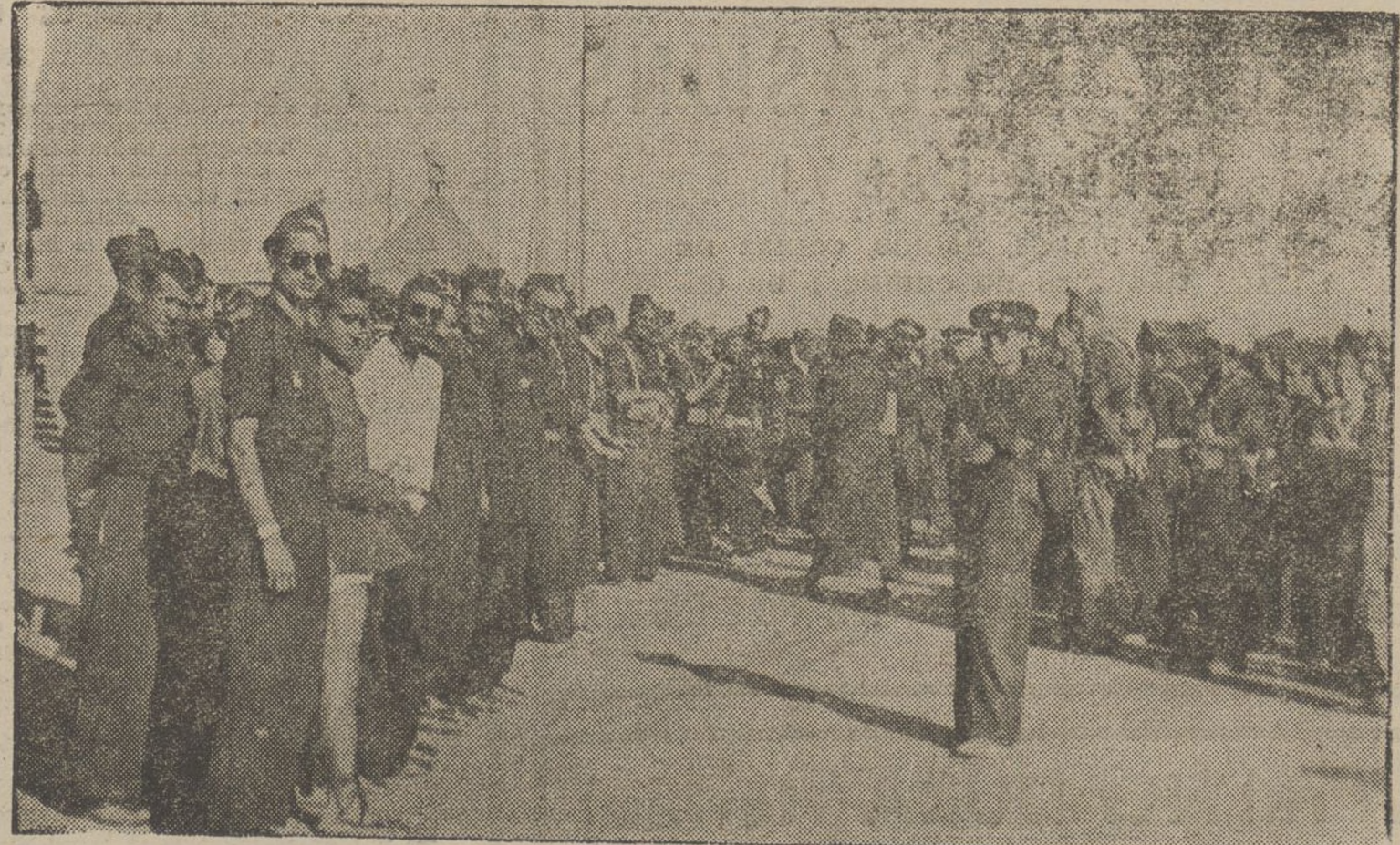
Coratge, bonhumor, camaraderia, esperit de lluita i d'heroisme. De tot això hi ha en el campament dels nostres admirables aviadors i de les forces que guarneixen aquest camp. Ahir prengueren, a les portes d'Osca la «Casa del Francès», reduïda des del qual els facciosos hostilitzaven les forces republicanes. A la foto els veiem a l'hora del correu esperant el repartiment de la correspondència.