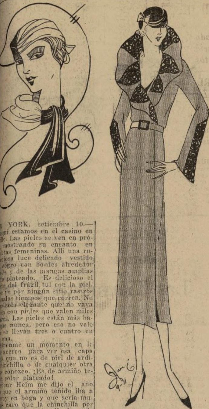
Precioso abrigo de otoño en lana verde con original cuello y puños de caracol negro