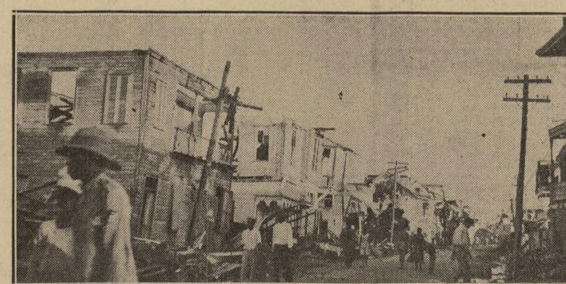
ESTADO LASTIMOSO en que quedó una de las principales calles de la ciudad de Belice, que acaba de ser casi totalmente destruida por un ciclón que, además de arrasar las tres cuartas partes de las casas de la capital de Honduras Británica, dejó en su rastro una lista de más de 1,200 muertos.