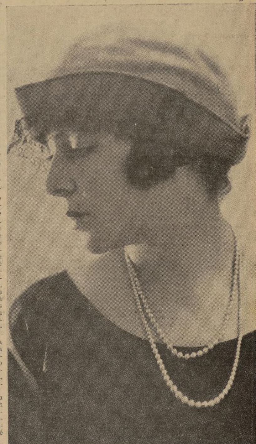
Catalina Bárcena, la gran actriz española, intérprete de la co- berbia producción cinematográfica, toda hablada en castellano, "Mamá", obra del genial autor Gregorio Martínez Sierra, que se exhibirá en función de gala en el teatro "Gil" de Brooklyn el pró- ximo viernes.