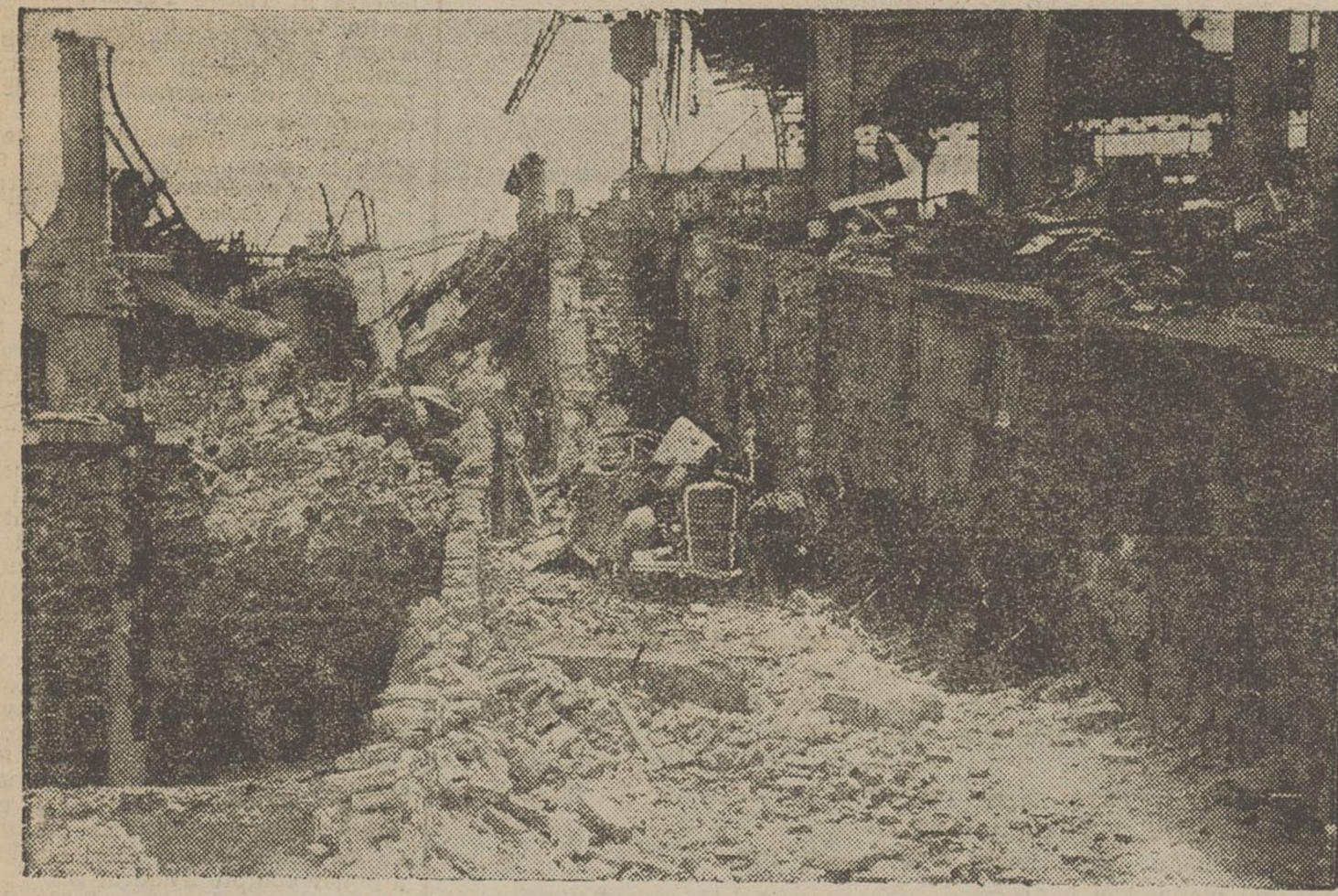
Les milícies populars han entrat a l'Alcázar de Toledo. Heus aquí els milicians asseguts, tranquil·lament, vora les runes, dins de l'Alcázar. Resten encara, als soterranis, alguns sublevats que van a ésser aprats pels milícies. Caldrà esperar que surtin o s'entrarà a cercar-los