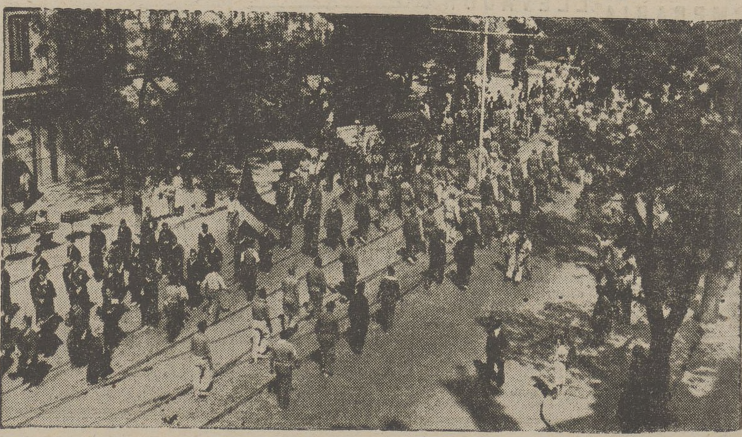
Ha tingut lloc a Madrid l'enterrament de cinc herois del 52. regiment que caigueren en els darrers combats al front de Somosierra. Les milícies catalanes que es trobaven a Madrid, assistiren a l'acte d'enterrament. Moment de la desfilada d'aquestes milícies en el seguici, pel carrer d'Alcalá