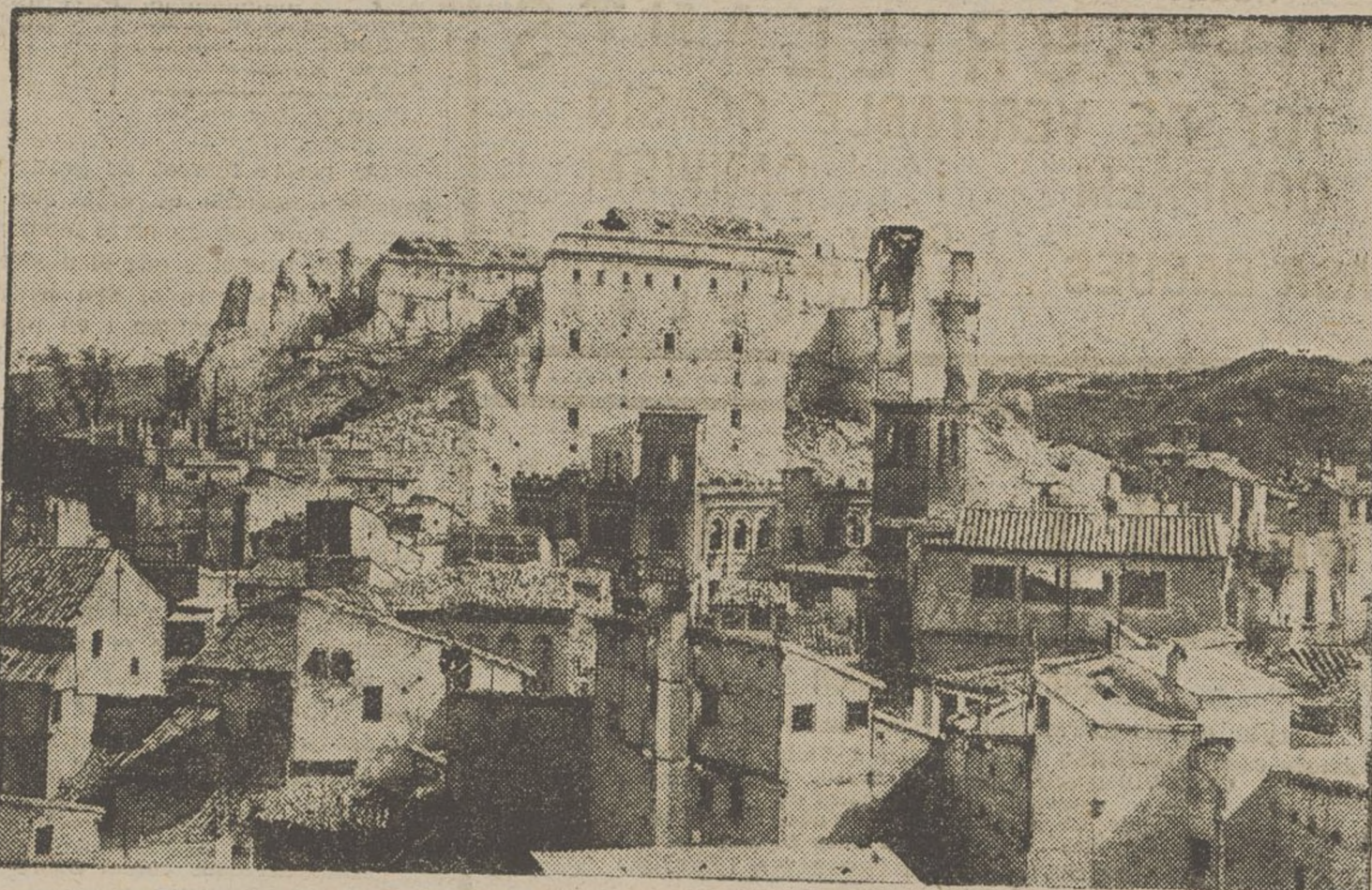
Un aspecte de l'Alcázar de Toledo després d'haver estat pres pels milicians