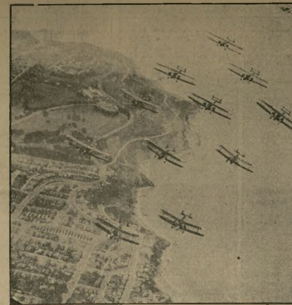
Bombardeo de aeroplanos en una batalla aérea dada en los campos de Golden Gate y Presidio, California, en cuyas maniobras tomaron parte más de sesenta aeroplanos.