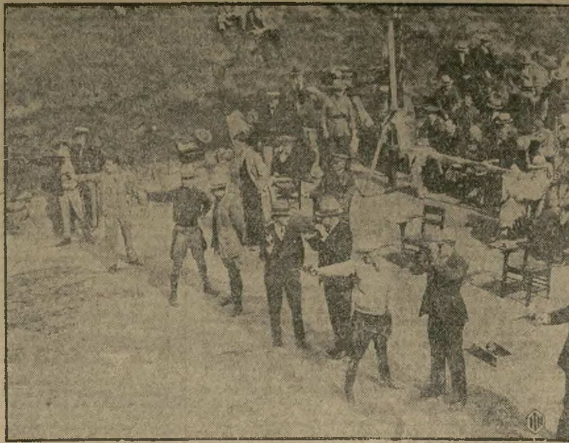
Vista general del interesante concurso de pistola que se ha celebrado en Trenton, N. J., en el que la policía neoyorquina ha salido victoriosa conquistando el máximo de puntos entre sus adversarios. Los guardias de New York batieron un record de 1,467 puntos, venciendo a los de Pennsylvania por 4.