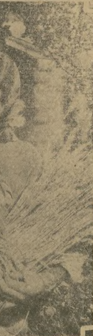
Completamente entregados el uno al otro, ¿no es cierto? Son Roy O'Malley y Sidney Fox, en una escena amorosa de "Lost Sheep", de estreno en el "Selwyn".