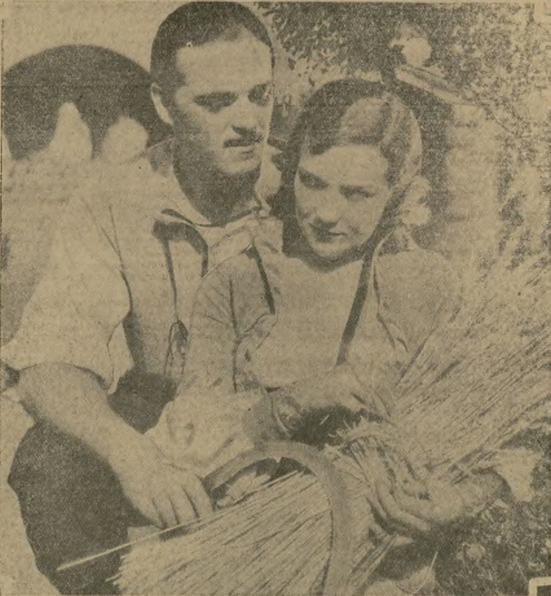
"Song of the Flame" fué estrenada anoche con gran éxito en el teatro Warner. Bernice Claire y Alvin Karpis aparecen aquí en una escena de esta magnífica producción.