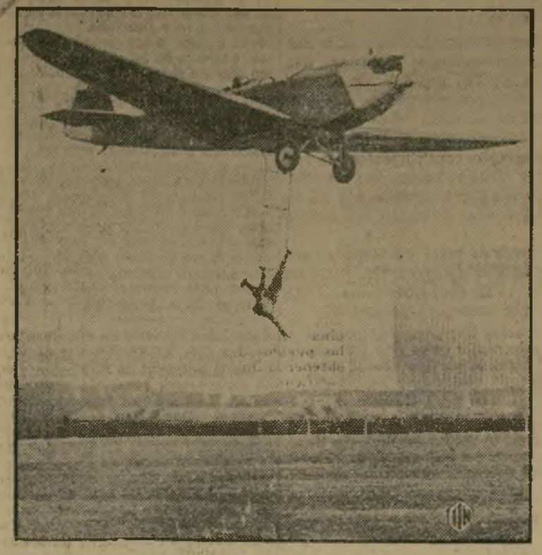
Fritz Schindler, "as" de la aviación alemana, cuyos experimentos de equilibrio desfilando en un trapezio pendiente de su aeroplano han pasado a la concurrencia berlinesa agrupada en uno de los aeródromos cercanos a Berlín.

(Continuación de la 2a. pág.) Roxas, quien concibió la consideración de los reunidos un proyecto de presupuesto preparado para el día en que las Filipinas obtengan la independencia y con el cual quiso demostrar que las islas pueden soportar la comoción económica que sufrirá al separarse de los Estados Unidos.