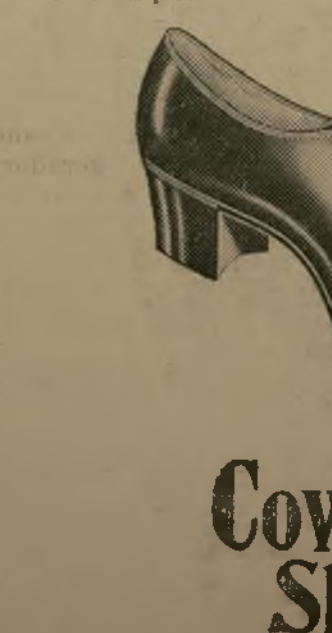
Zapatos y medias para hombres, mujeres y niños.

SANTIAGO, 12 mayo.—(A). El ministro colombiano, señor R.