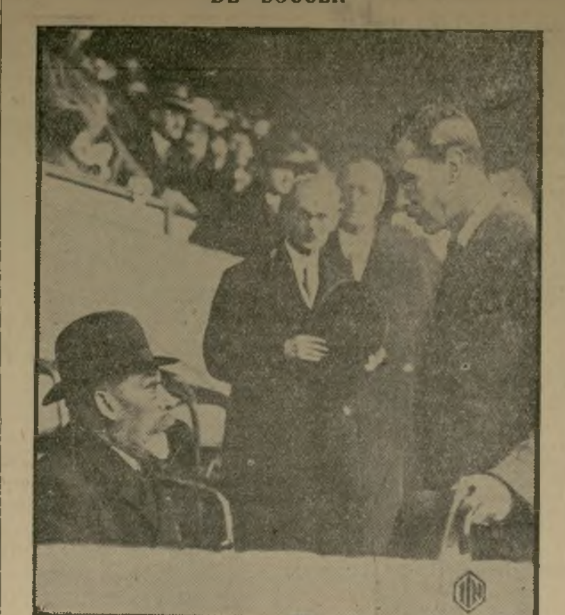
El rey Jorge de Inglaterra y su hijo el duque de York, conversando en uno de los intermedios del partido de "soccer" celebrado en Wembley. Al fondo miembros de la familia real inglesa, que asistieron también al partido.