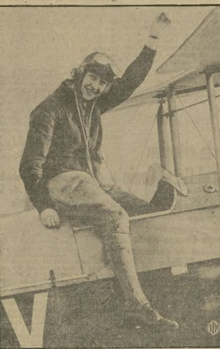
Miss Amy Johnson, joven aviadora inglesa de 22 años que acaba de realizar un brillante vuelo a Australia, cubriendo un recorrido de 10,000 millas. Miss Johnson pretende batir el record de distancia entre mujeres y vencer a Bert Hinkler, que estuvo en el aire 16 días y medio.