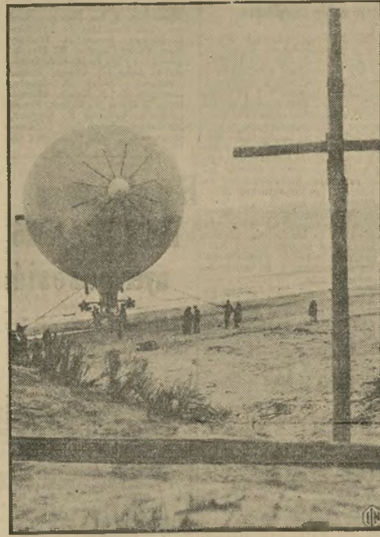
Capitán John Smith y otros compañeros, visitando el histórico paraje de Virginia Beach, en donde se conserva la cruz de madera que erigieron los primeros “pioneers” británicos al llegar a tierras de América. En este pequeño puerto desembarcaron hacia 1607 los tripulantes de las tres famosas embarcaciones inglesas, “Sarah Constant”, “Godspeed” y “Delivery.”