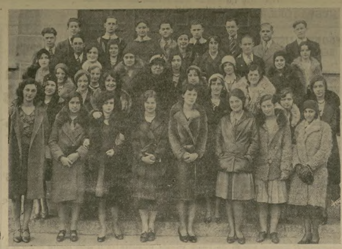
Reciente fotografía del Círculo Español de Richmond High School, tomada después de efectuar una de sus reuniones. Este círculo, con más de cincuenta socios, organiza simpáticas fiestas españolas, funciones de teatro que les hacen recordar con fruición los estudios de español. Los jóvenes estudiantes preparan para despedida de curso un animado baile de máscaras que se verificará el 6 de junio, con la asistencia de alumnos y profesores y en el que cada cual lucirá su inventiva y habilidad en la creación de un disfraz típico hispano.