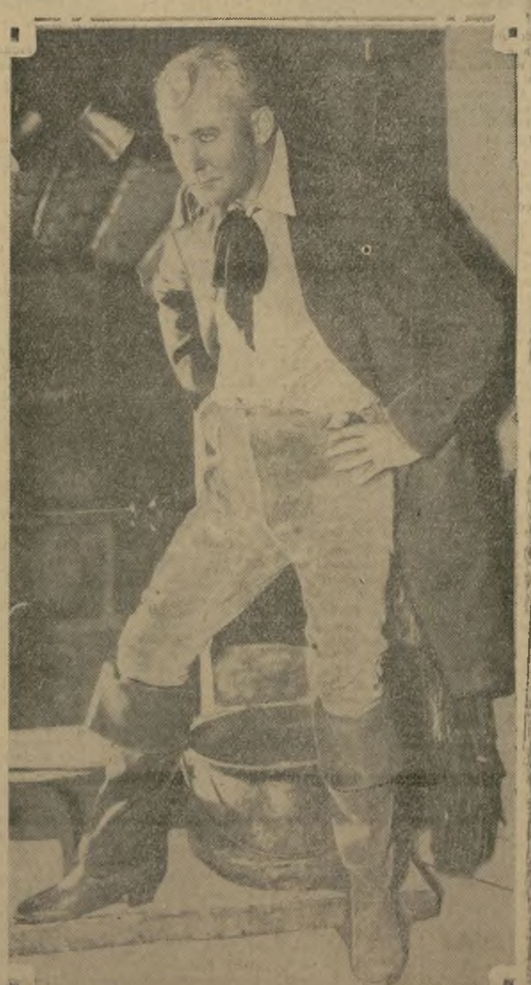
Cualquiera tomaría a George M. Cohan por Napoleón en esta actitud, ¿no es cierto? Pero se trata en realidad de "The Tavern", la obra en que actúa al presente en el teatro "Fulton".