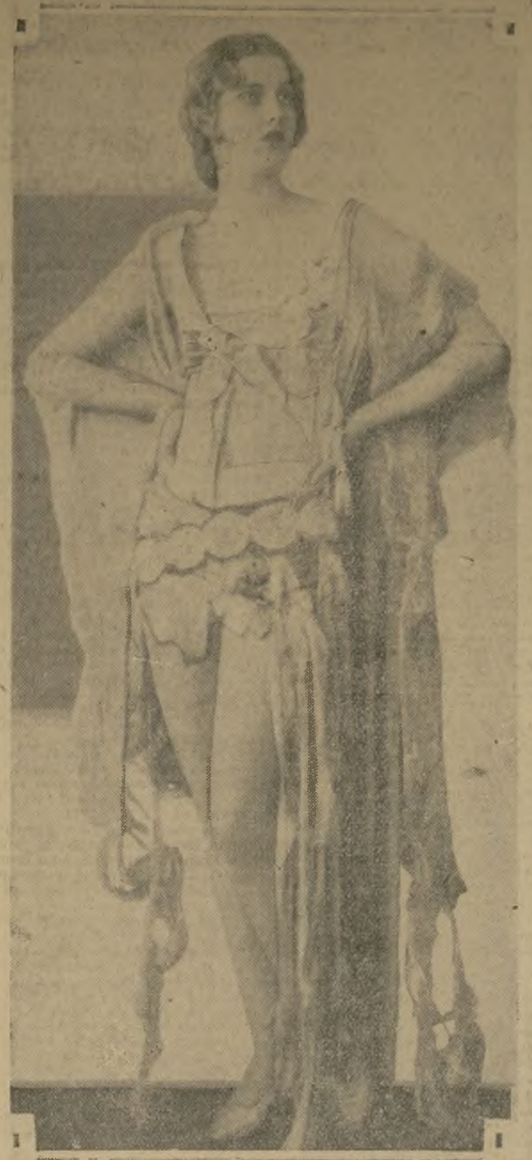
Caja Eric, la escultura que veis aquí, es una de las razones por las cuales los cuidados hombres de negocios están frecuentando tanto el teatro "Ziegfeld", donde continúa representándose con gran éxito de taquilla la revista "Simple Simon".

TAQUIGRAFAS , subvención en LA PRENSA. Oportunidad para el estudiante de la escuela para aprender un buen empleo.