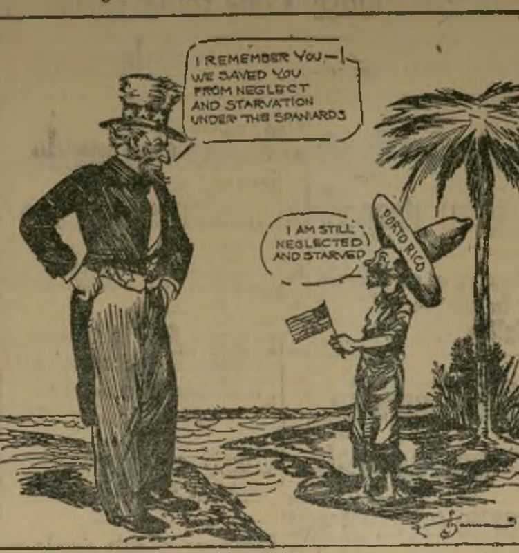
(Cartoon publicado por el "Herald News") TIO SAM.—Me acuerdo de ti. Te libramos de la indiferencia y miseria que padecías bajo el régimen español. PUERTO RICO.—Todavía se me desatiende y estoy hambriento.