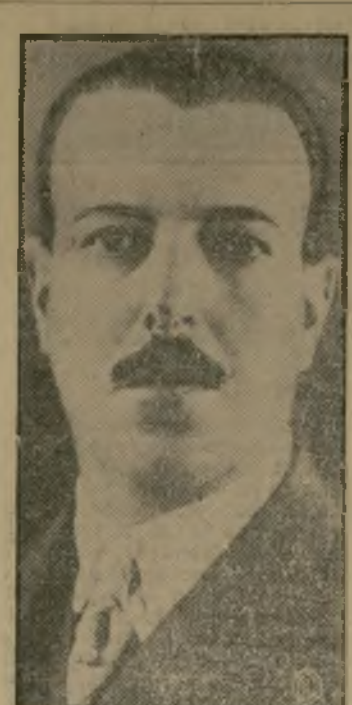
Dr. Julio Prestes de Albuquerque, quien hablará esta noche por radio.