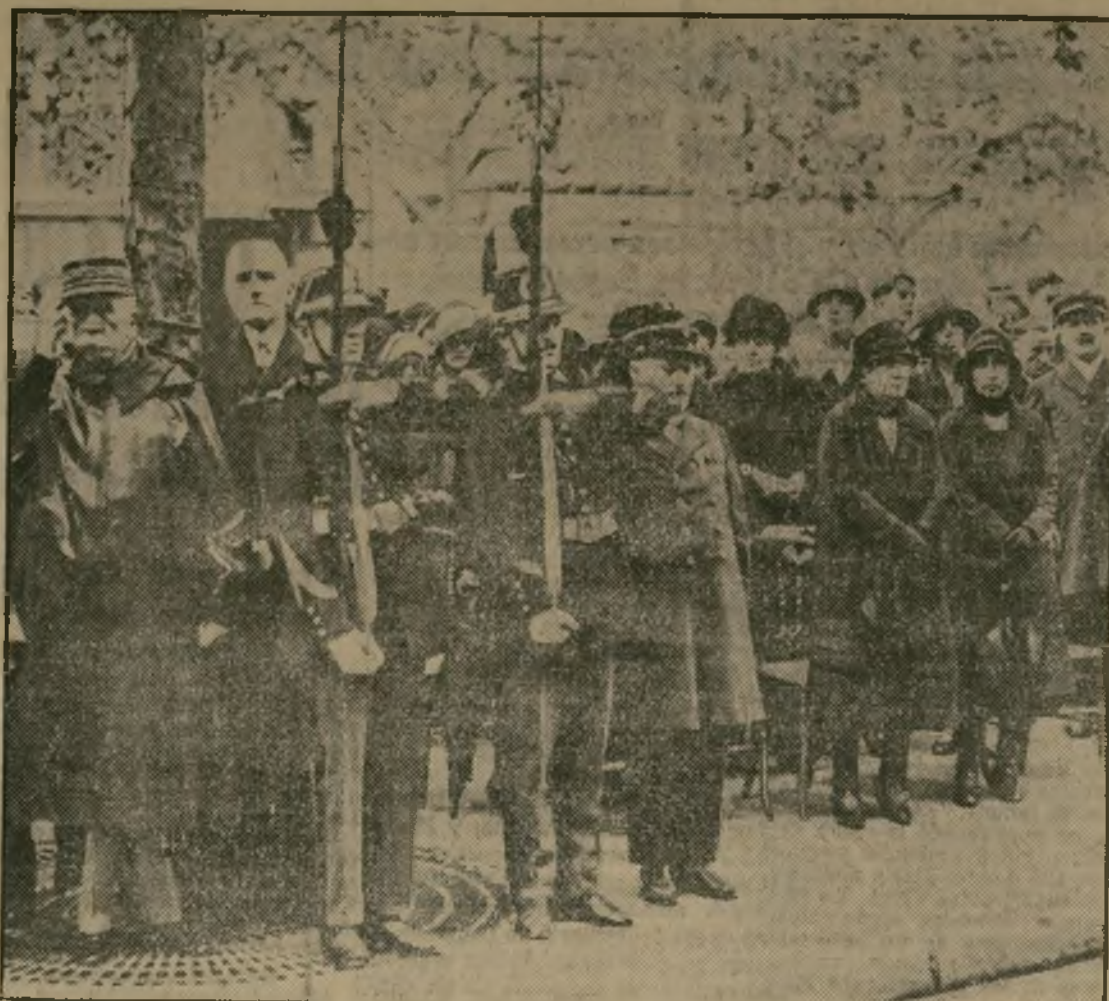
Monumento solemne de descubrir la placa conmemorativa colocada en la casa que habitó el mariscal Foch en París durante la guerra mundial. A la derecha de esta fotografía puede verse a la viuda del mariscal en compañía de su hijo. A la izquierda aparecen el general Weygand y el mariscal Lyautey.

HONRANDO LA MEMORIA DE UN GUERRERO FRANCES