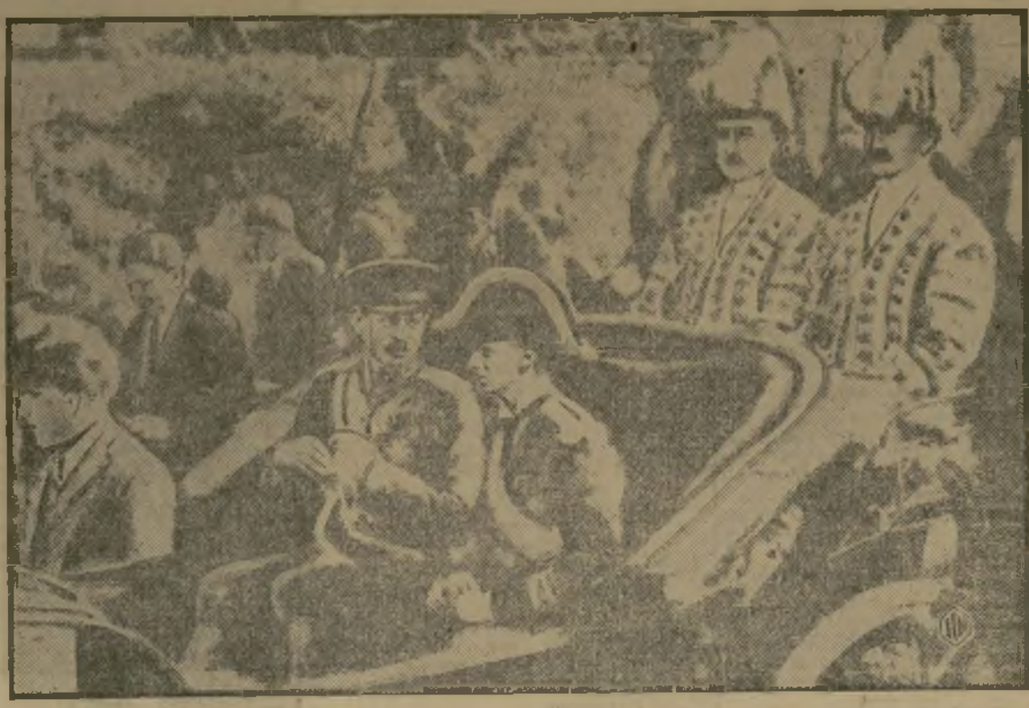
La llegada de Carol II a Bucarest constituyó un gran acontecimiento en la capital de Rumania y la prensa mundial concentró su atención en los acontecimientos que desarrollaron en ese país durante varios días. El nuevo monarca de Rumania aparece aquí sentado al lado de su hermano, el príncipe Nicolás, en el carruaje en que hizo su entrada triunfal en la capital.