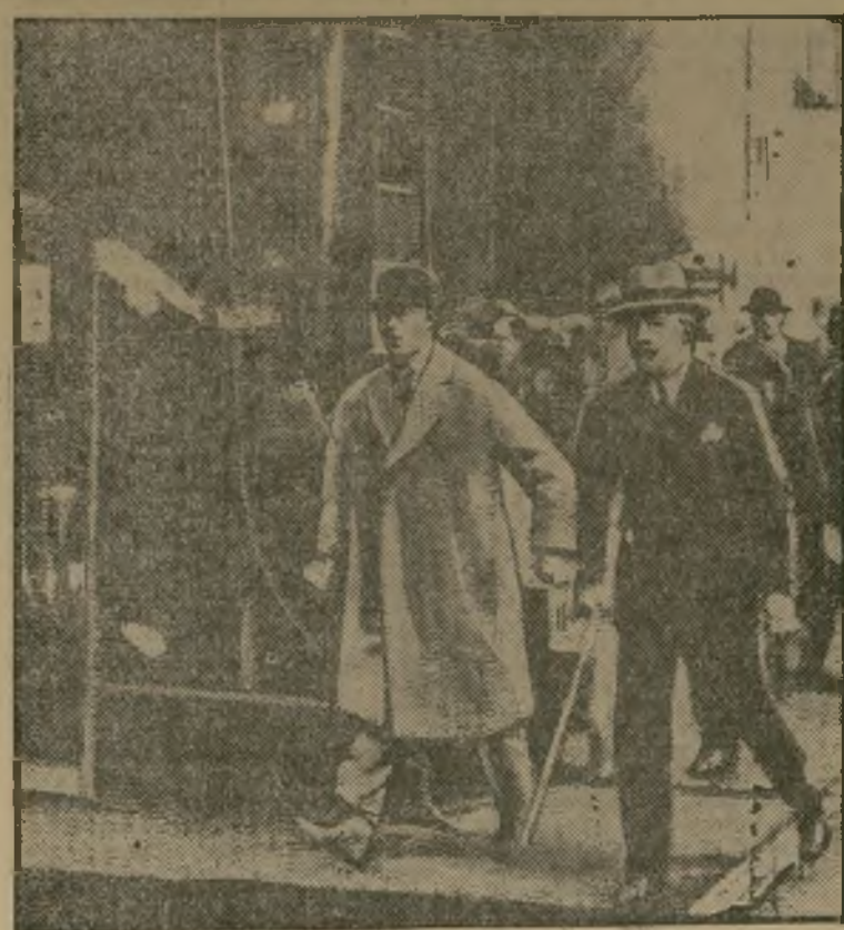
El príncipe de Gales, que por vez primera ha tomado parte activa en el bautizo de un nuevo trasatlántico, aparece aquí en el momento de entrar en los astilleros, acompañado de E. W. Besty, presidente de la compañía naviera, pocos momentos antes de ser botado al agua el vapor "Empress of Britain". Esta fotografía fue transmitida a los Estados Unidos por radio.

EL PRINCIPE DE GALES EN LA ROTADURA DE UN ENTRE LA PROTESTA EXTRANJERA Y MUCHA INCERTIDUMBRE NACIONAL