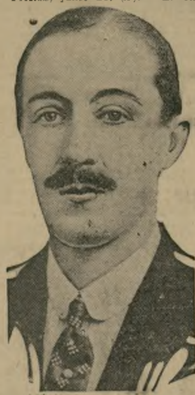
El duque de Alba