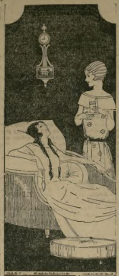
La mujer que con su personalidad puede contribuir al bienestar de otros es una bendición en el hogar de un enfermo.

Para alquilar un cuarto, un apartamento o una casa, consulte los anuncios que en las respectivas columnas se publican diariamente en la PRENSA. Es medida que le ahorrará tiempo y le economizará dinero. Anuncio.