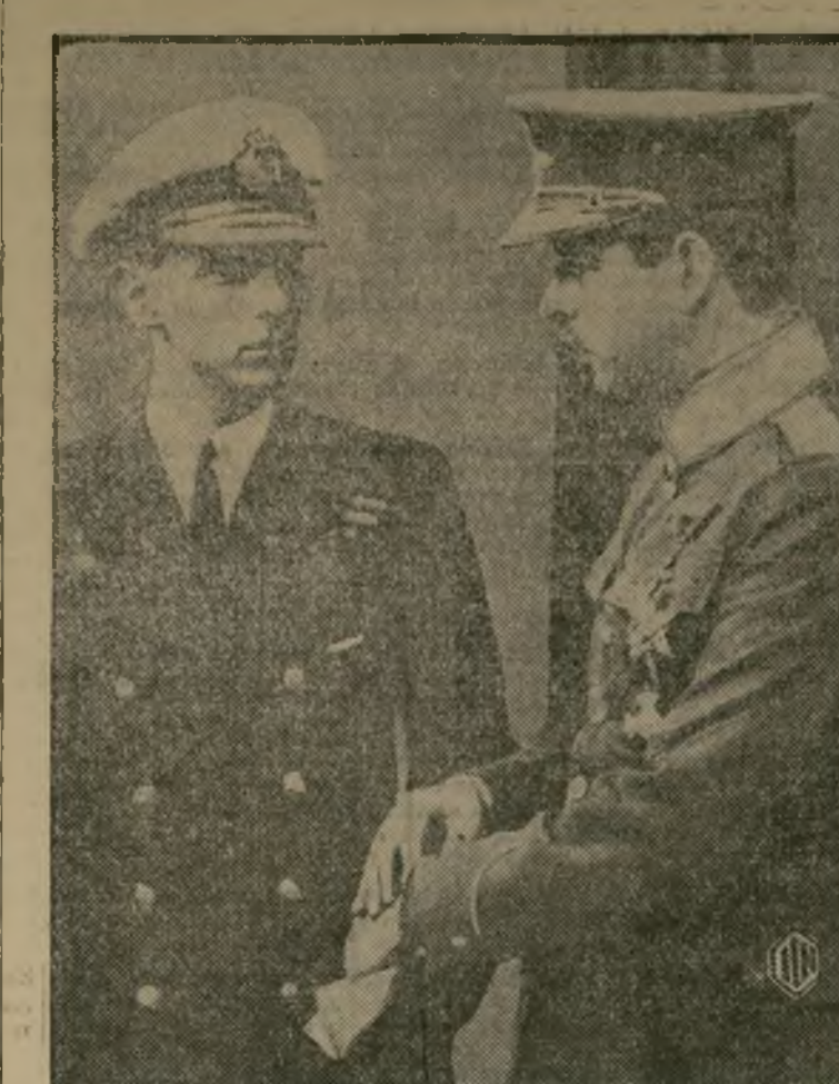
El rey Carol II de Rumania aparece aquí hablando familiarmente con su hermano, el príncipe Nicolás, que parece ser quien más empeño puso por lograr el retorno a su patria de Carol. La fotografía se tomó después de la visita que ambos hicieron a la tumba de su padre el rey Fernando.

EL REY DE RUMANIA EN COMPAÑIA DE SU HERMANO