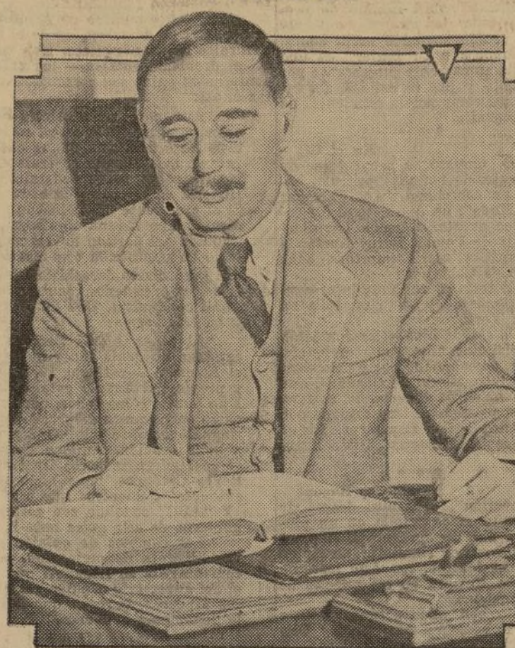
El gran novelista inglés H. G. Wells, que se halla de visita en los Estados Unidos, fotografiado en su hotel de Nueva York y que predice, que a menos que las naciones del mundo se unan, piensa el vivir para redactar una obra relatando el derrumbe de la actual civilización.