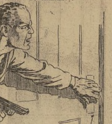
— Fu Manchú — griteño Smith, lanzándose sobre el forjado con agilidad de tigre. Siente como un resorte y me adelanté a las escaleras...

Nashland Smith venía tras de mí corriendo por un suceso y oscuro pasadizo de pronto sentí una ráfaga de aire puro y tropecé con una puerta secreta que la abrió de un empujón. Me encontré en una habitación... Fu Manchú.