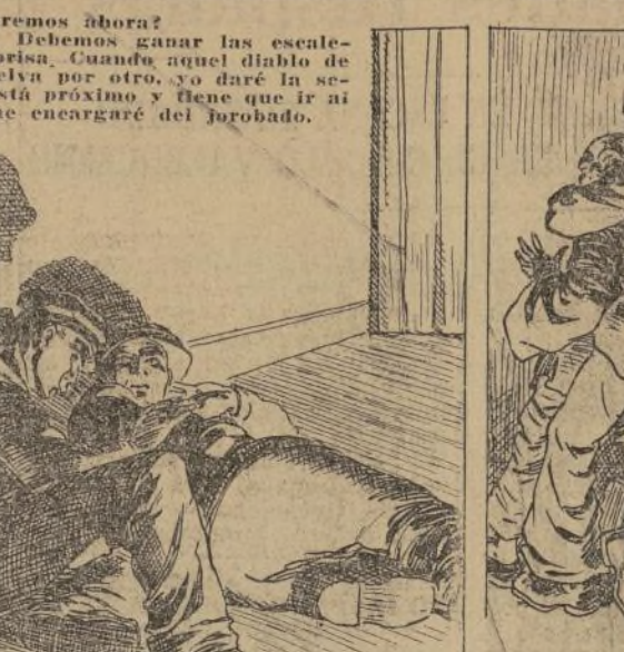
— Fu Manchú — griteño Smith, lanzándose sobre el forjado con agilidad de tigre. Siente como un resorte y me adelanté a las escaleras...

— ¿Qué haremos ahora? — Esperar. Debemos ganar las escaleras a toda costa. Cuando aquel diablo de forjado vuelva por otro, yo daré la señal. Tardará en volver y entonces, ya al frente, yo me encargaré del forjado.