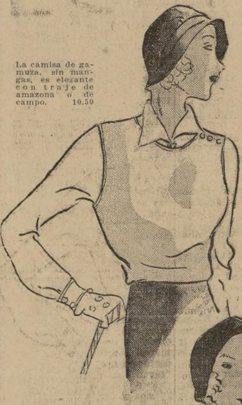
La camisa de gamuza, sin mangas, es elegante con traje de amazona o de campo. 10.50