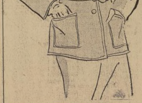
Esta chaqueta deportiva, en gamuza, es copia de un estilo masculino y abultada en la parte superior de la ajustada falda. 15.50