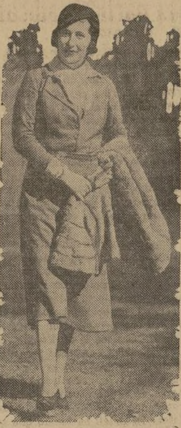
La conocida cantante de ópera Luciezia Bori, fotografiada recientemente en White Sulphur Springs, W. Va., en donde se halla de vacaciones otoñales.

ir a la pesca mar adentro, sin lograr, empero, mucho éxito.