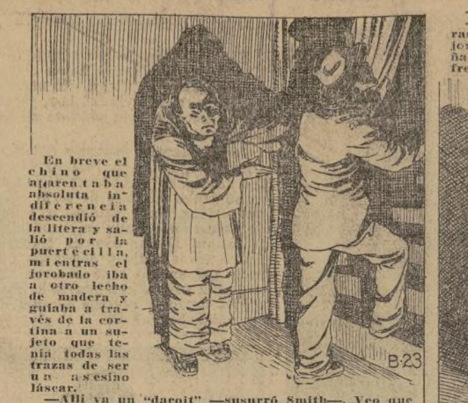
— Fu Manchú — griteño Smith, lanzándose sobre el forjado con agilidad de tigre. Siente como un resorte y me adelanté a las escaleras...

En breve el chino que asesinó a la esposa de un hombre de negocios, se verá en un "doble" — susurro Smith. — Veo que viene a este sitio a tomar órdenes y dar informes de sus criminales actividades. Seguro estoy que Fu Manchú se encontrará aquí.