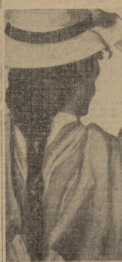
Indios del Ecuador

te de bella composición—Y más es, fuerte, acendada, respirando la alicia y severa majestad, llena de ricos tonos, de Castilla. La pintura del retrato de López Mezquita pres-