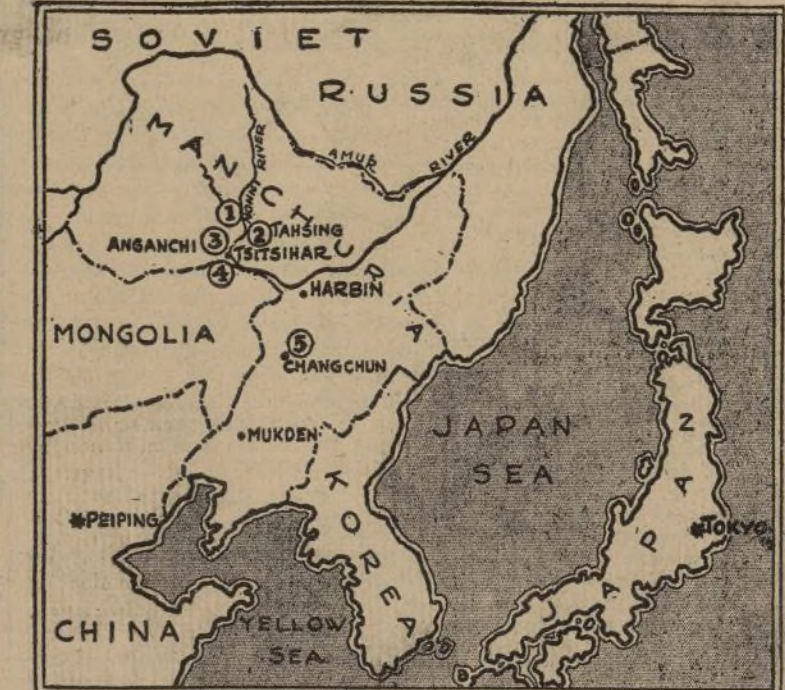
MAPA DEL FRENTE CHINO-JAPONES

Este mapa muestra el teatro de las presentes hostilidades entre japoneses y chinos en Manchuria, que el mundo entero sigue con marcada ansiedad. Nótese cómo la lucha se ha corrido desde Mukden, hacia el norte, al puente del río Nonni (1); Tshing (2); Anganchi (3); Tshihar (4) y Chang-Chun, todo en las proximidades de las zonas ocupadas por Rusia, lo cual tiende a una nueva complicación, con este último país.