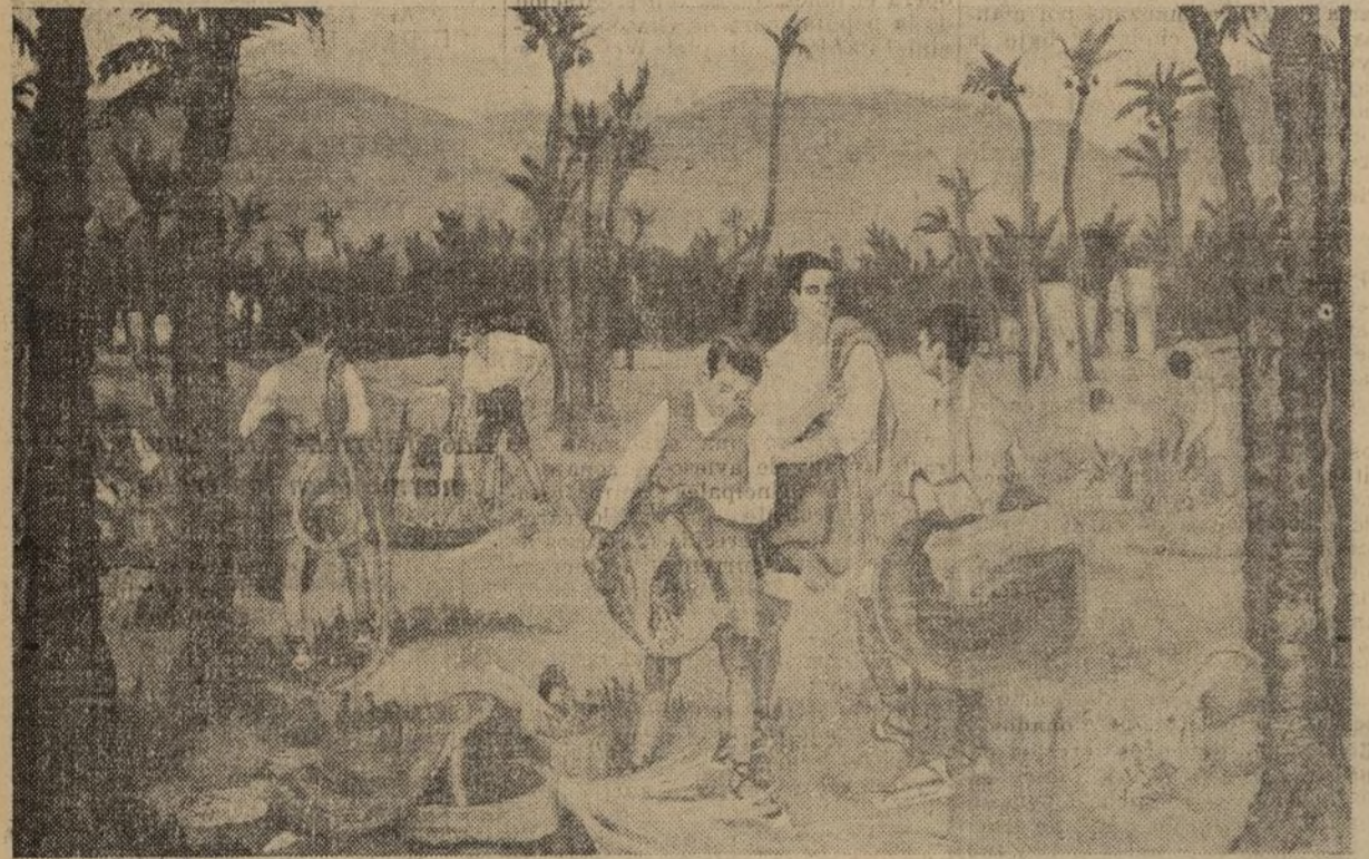
'Datileros,' impresión de Elche.

hibición, es una impresión de Avilés, fuerte, acendada, respirando la alicia y severa majestad, llena de ricos tonos, de Castilla. La pintura del retrato de López Mezquita pres-