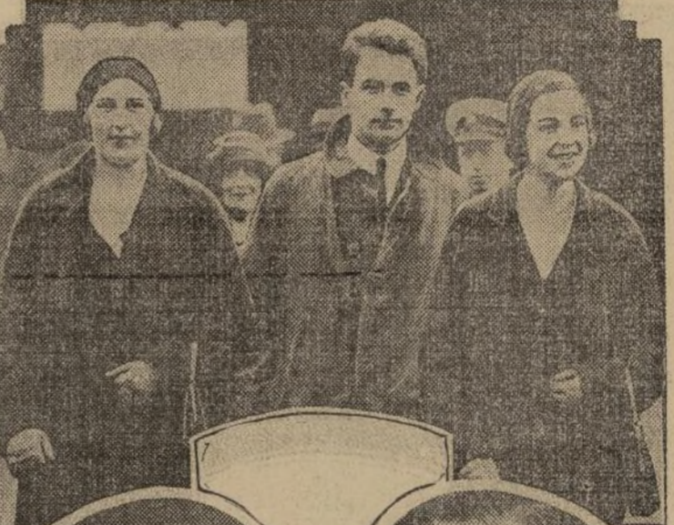
LAS HIJAS de los ex soberanos de España, infanta doña Cristina (izquierda) y doña Beatriz (derecha), fotografiadas de paseo por Irlanda, recientemente, en compañía del infante don Alvaro de Borbón-Orleans (centro), quien próximamente contraerá enlace con la segunda de dichas princesas. Hace unos días circularon rumores de que el matrimonio no se efectuaría debido a la salud de la novia, rumores que fueron desmentidos. Abajo aparece el ex monarca don Alfonso y el ex príncipe Alfonso, cuya salud, sí, es verdaderamente precaria.