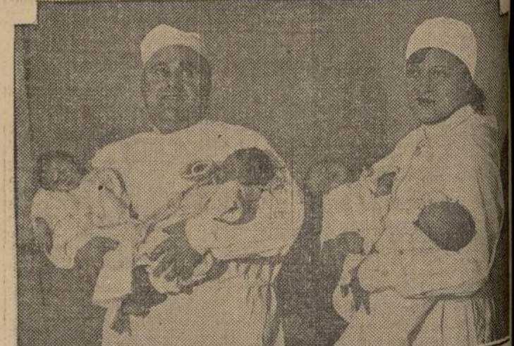
EL TENOR Beniamino Gigli y la soprano Rosa Ponselle, ambos del Teatro Metropolitan de la Opera Nueva York, visitaron hace pocos días el Columbus Hospital y estuvieron cantando canciones de cuna a los pequeños queñines. Rara vez se da el caso que los bebés se vean arrullados por semejantes eminencias.