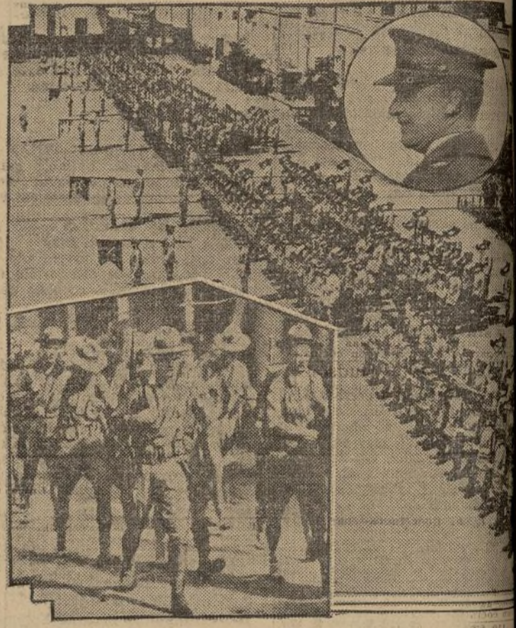
A MEDIDA que la situación en China se agrava debido a las hostilidades entre japoneses y chinos, los Estados Unidos observan la situación más atentamente. Aquí tenemos el 150. regimiento de infantería americano destacado en la concesión extranjera de China, formado marcialmente. En el círculo, su coronel, James D. Taylor y en el ángulo un destacamento típico de dicho cuerpo, en marcha.