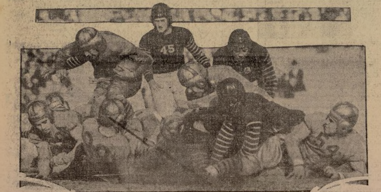
UN MOMENTO de culminante interés en el reciente partido de fútbol jugado en Berkeley entre los equipos de la Universidad de California, saliendo aquellos derrotados por 13-0.