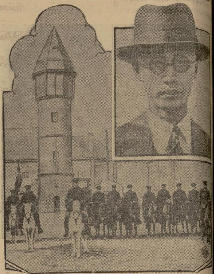
EN VISTA de la gravedad de los acontecimientos en China los Estados Unidos observan cada vez con mayor atención el desarrollo de los acontecimientos. Aquí presentamos al destacamento de caballería del 150. regimiento americano que se halla de guarnición en Tientsin, en la Concesión Extranjera.