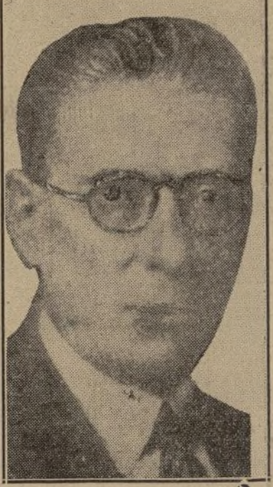
Señor Neptalí Bonifaz Ascáubi, presidente electo del Ecuador.