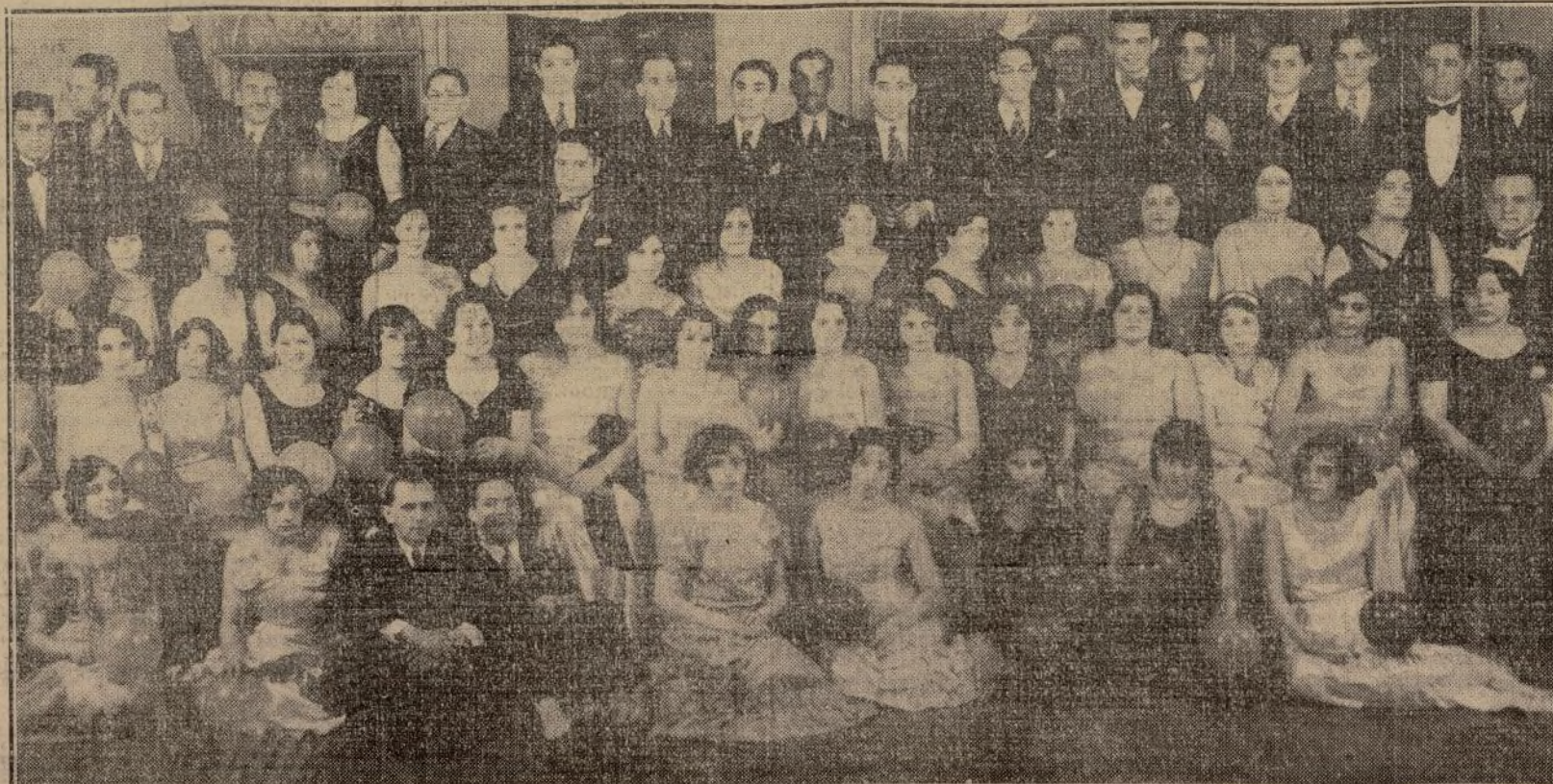
Un grupo de concurrentes al baile celebrado por el Club Boliv Ar, en el Hotel Monterrey. En el centro, una nutrida representación de nuestras colonias.