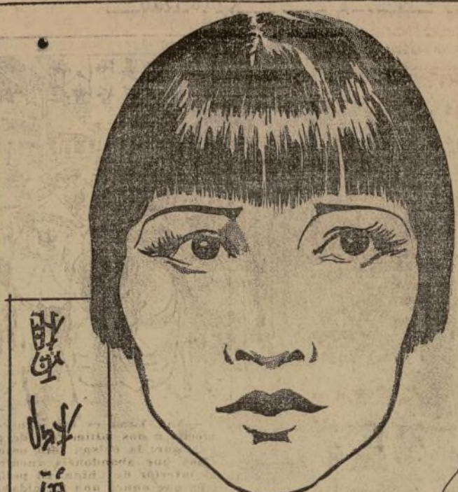
ANNA MAY WONG

cuyo verdadero nombre es Wong Lui Esong, que significa "Mimbrres Amarillos Helados", nació en San Francisco, y no en China, como generalmente se cree.