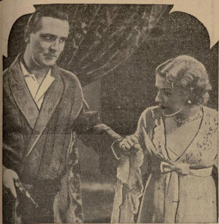
Una escena, nada tranquilizadora por cierto, de la película "Murder at Midnight", que se empieza a exhibir hoy en el teatro "Mt. Morris".