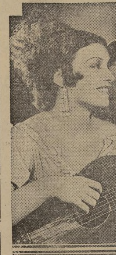
La seductora Conchita Montenegro y el impetuoso Edmund Lowe en el nuevo episodio de "The Cisco Kid", que se pone hoy en el lienzo del "Loew" de la 116, hasta el viernes.