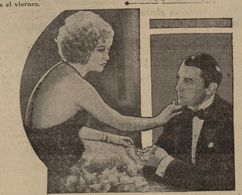
Ella es Miriam Hopkins y él Clive Brook, la cinta se titula "24 Hours" y el teatro donde empieza a exhibirse hoy es el "Jewel".