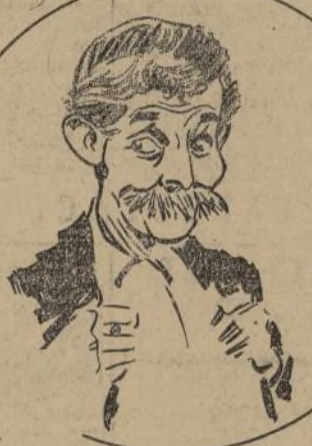
JIMMIE "SCHNOZZLE" DURANTE

ha representado 82 papeles de personajes que fluctúan entre 12 y 30 años y que pertenecían a personas de ambos sexos.