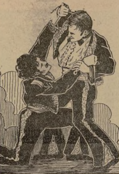
Una escena de la hermosa producción, toda hablada en español, "Campanas de Capistrano", que empieza a exhibirse el viernes en el teatro "San José."

710 K.—WOB—422.3 M. 8.30 P. M.—Variaciones. 9.00 P. M.—Variaciones. 9.30 P. M.—Variaciones. 10.00 P. M.—Variaciones. 10.30 P. M.—Variaciones. 11.00 P. M.—Variaciones. 11.30 P. M.—Variaciones. 12.00 P. M.—Variaciones.