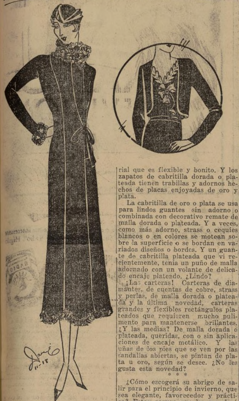
Elegante abrigo de tarde de terciopelo marrón con astracán

NEW YORK, 17 noviembre.—La moda metálica en las modas para noche y obscuro va tomando auge cada día. No solamente son de lamé los vestidos y blusas y adornos, sino también los zapatos, guantes, carteras, medias en materiales metálicos.