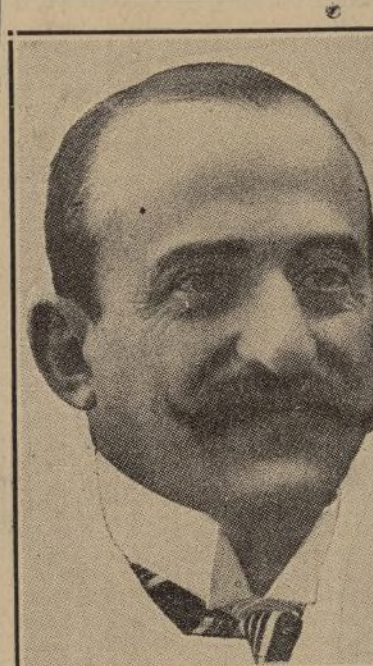
Señor Conde de Romanones

Romanones defendió briosamente al ex rey.—La sentencia comunicada a la Liga.—Todos los generales de la Dictadura exculpados