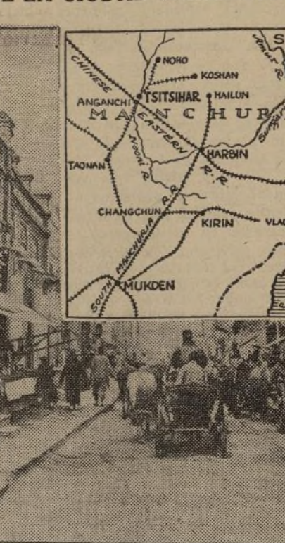
Una de las calles principales de la ciudad amurallada de Tsitsihar, que los japoneses acaban de ocupar después de una batalla en la que emplearon todos los medios de destrucción de la moderna guerra. El mapa muestra la zona del conflicto, con Mukden, donde empezaron las hostilidades, que se han ido corriendo hacia el norte, o sea hacia la parte de influencia rusa.

UNA CALLE DE LA CIUDAD MANCHURIANA TSITSIHAR