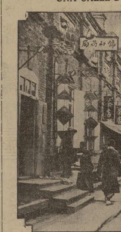
Una de las calles principales de la ciudad amurallada de Tsitsihar, que los japoneses acaban de ocupar después de una batalla en la que emplearon todos los medios de destrucción de la moderna guerra. El mapa muestra la zona del conflicto, con Mukden, donde empezaron las hostilidades, que se han ido corriendo hacia el norte, o sea hacia la parte de influencia rusa.

UNA CALLE DE LA CIUDAD MANCHURIANA TSITSIHAR