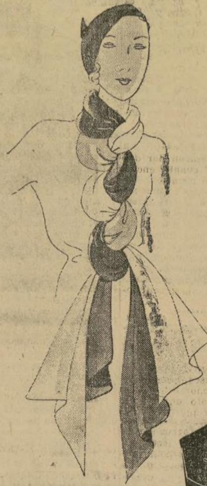
Best ha copiado el collar de seda de color rojo y negro, con un metro de 2 colores, marrón, negro y rojo, y otras combinaciones originales de Schiaparelli 2.50. Piso principal.