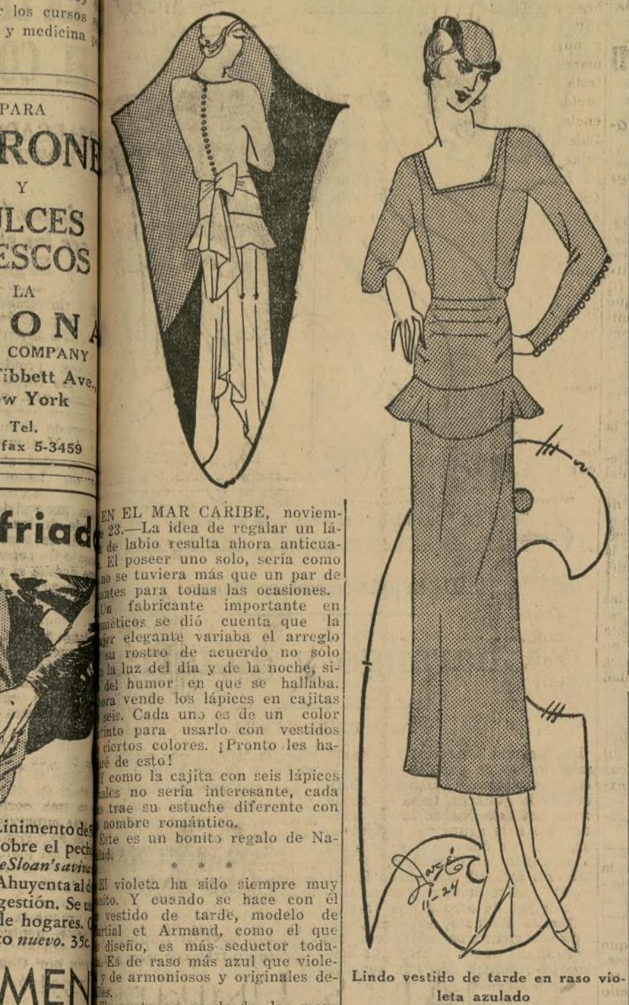
Lindo vestido de tarde en raso violeta azulado