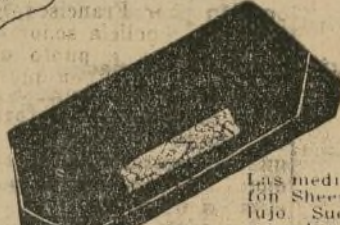
Nueva y delicada cartita de Navidad con adornos de seda y maraca. Negro, marrón, color vino 6.95. Piso principal.

Vestuario para Navidad—no porque sea práctico (aunque puede serlo)—sino porque las prendas de última novedad, de colores brillantes y distintivas es lo más interesante que se puede regalar o recibir!