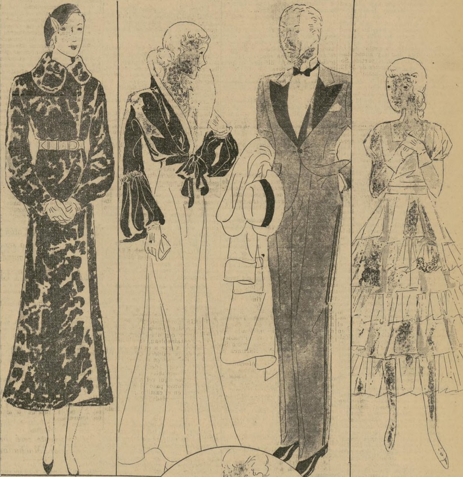
Abriego de jaca lisa con cinturón de cuero. Negro o marrón. Forro de crepe de color. Tamaños 14 a 20. 14.99. Tercer piso.