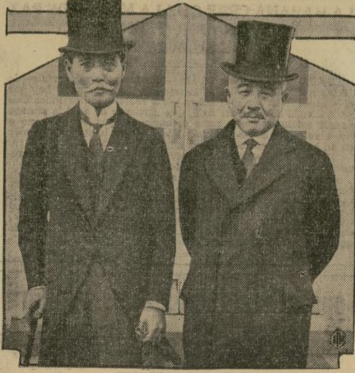
EL SEÑOR YUKIO OSAKI (izquierda) ex alcalde de Tokio, y que donó los famosos cerezos que adornan a la ciudad de Washington, D. C., saliendo de visitar al presidente Mr. Hoover en la Casa Blanca con motivo de su reciente paso por la capital federal. A la derecha está el señor Debutchi, que le acompañó, embajador japonés en Estados Unidos.