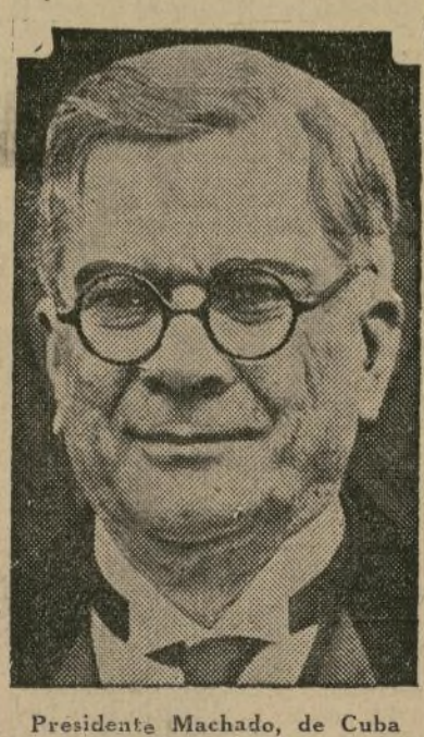
Presidente Machado, de Cuba

Esperaba a que los opositores depusieran la actitud francamente revolucionaria