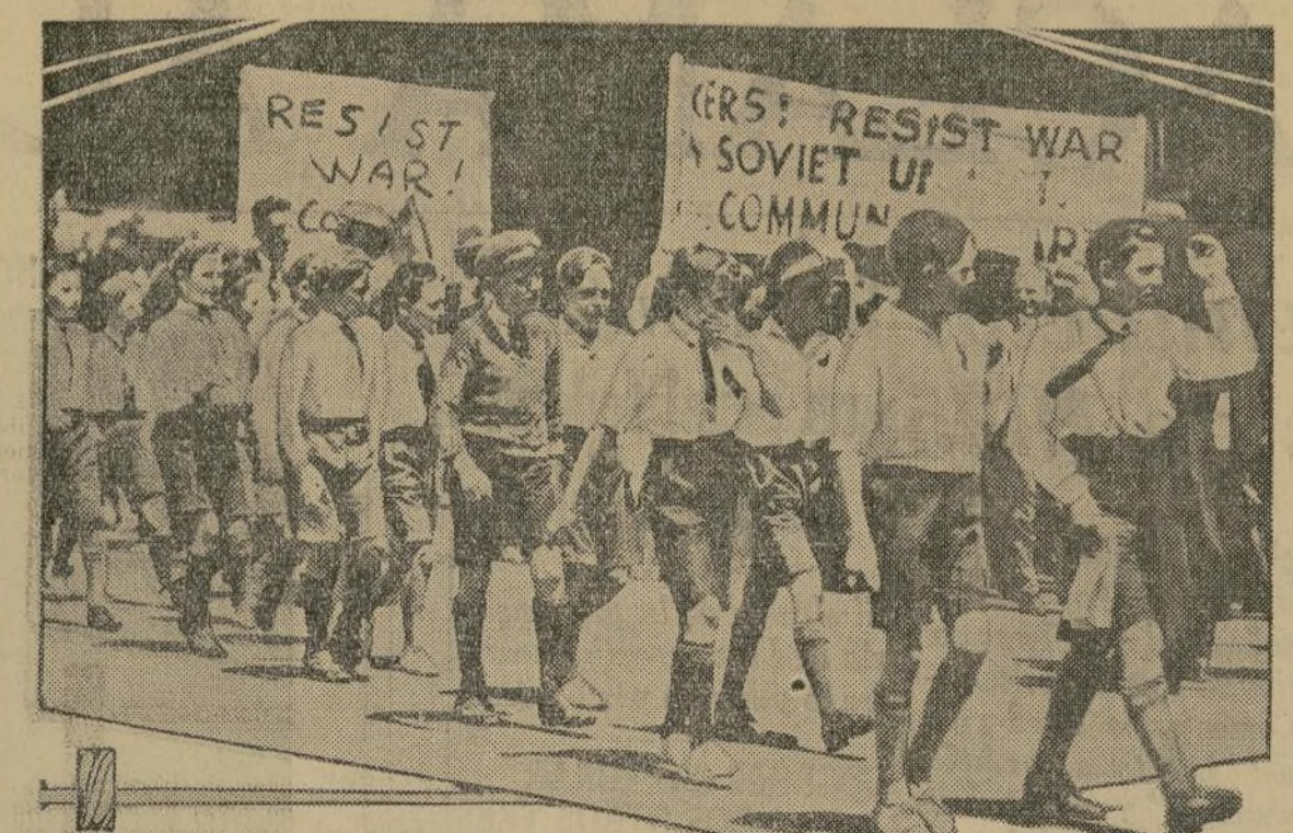
Un desfile de chicos comunistas de Sidney (Australia) que recientemente celebraron allí una manifestación en favor de la Rusia de los Soviets. Como puede verse la "fiebre roja" como el "flu" son en enfermedades que no respetan ningún país de la tierra.