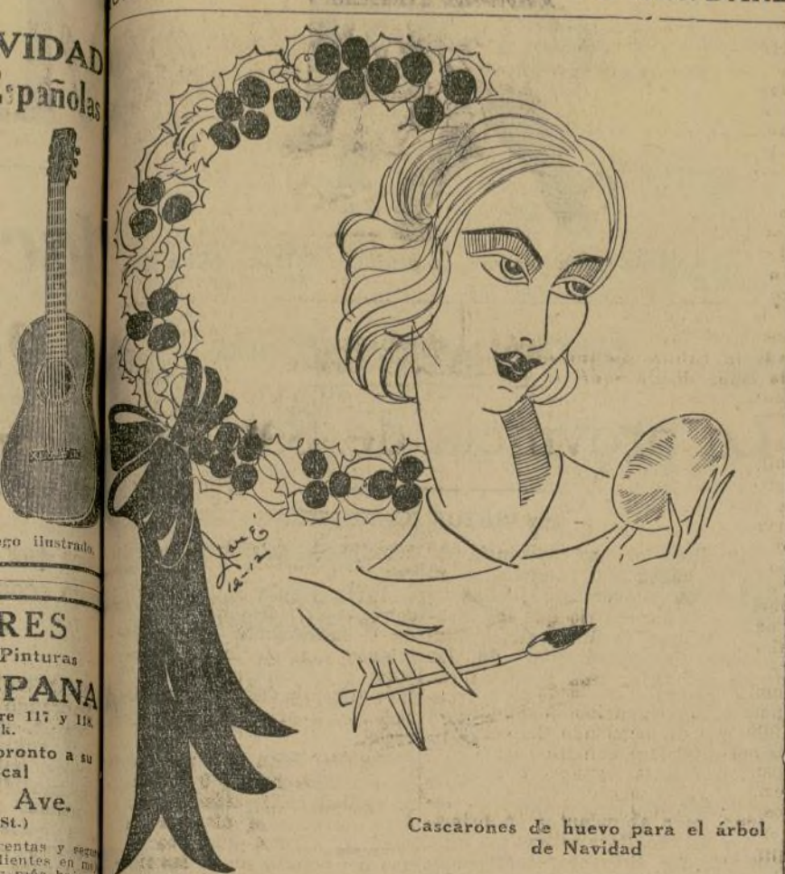
Cascarones de huevo para el árbol de Navidad

hemos acabado bien de pa- de hacerlos felices, gozaremos con ellos! Tal vez parezca un despilfarro el dinero que se invierte en adornos de Navidad. Lo mejor es hacer una fiesta y que cada concurrente haga un adorno interesante para el árbol. Dándole dulces y refrescos como obsequio. Además los adornos de brillo cuestan muy poco.