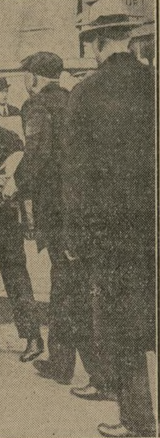
El cadáver de Jack "Legs" Diamond, famoso jefe de bandidos de Nueva York, sacado de la casa de pensión en Albany, N. Y., en que habitaba y en donde fue asesinado en la madrugada de ayer. Se sospecha que alguna pandilla de enemigos sea la que ha terminado con la espectacular y funesta carrera de "Legs".