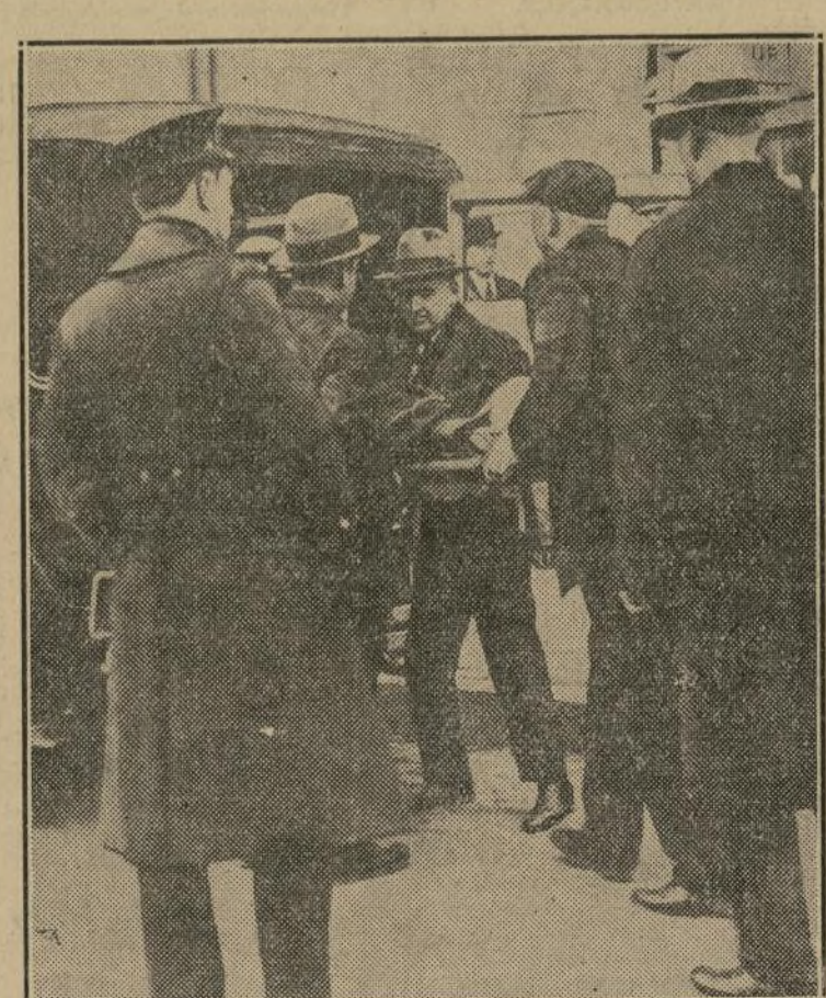
El cadáver de Jack "Legs" Diamond, famoso jefe de bandidos de Nueva York, sacado de la casa de pensión en Albany, N. Y., en que habitaba y en donde fue asesinado en la madrugada de ayer. Se sospecha que alguna pandilla de enemigos sea la que ha terminado con la espectacular y funesta carrera de "Legs".

LA CAMARA BAJA DEL CONGRESO ANTICIPABA ANOCHE DAR SU APROBACION A LA MORATORIA