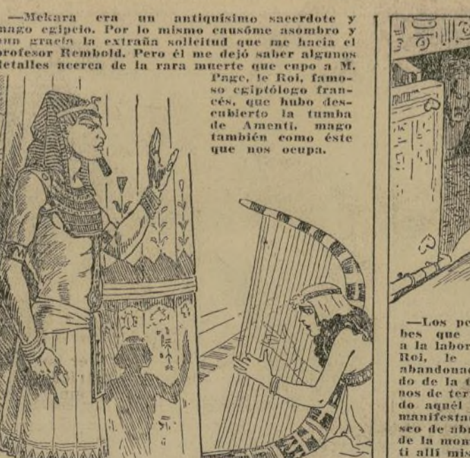
© 1931 by Sax Rohmer and The Bell Syndicate, Inc.