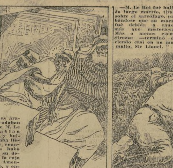
© 1931 by Sax Rohmer and The Bell Syndicate, Inc.