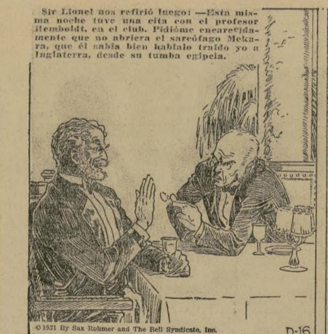
© 1931 by Sax Rohmer and The Bell Syndicate, Inc.