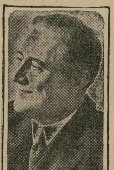
FRANKLIN D. ROOSEVELT