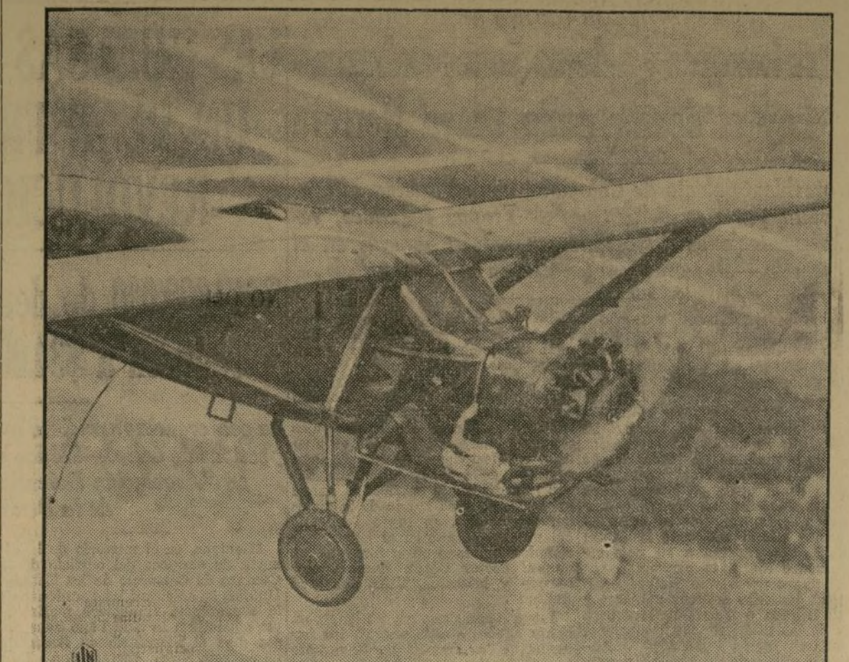
Los hermanos Hunter, no contentos con haber batido el record de resistencia en el aire, desean establecer una marca difícil de igualar por futuros aspirantes. En su nave "City of Chicago", se turnan en pilotear y hacer reparaciones en los forzados motores. En los últimos mensajes transmitidos por los osados aviadores, manifiestan que continuarán su vuelo "mientras duren el tejido y los alambres."

REVISANDO EL MOTOR EN VUELO DE RESISTENCIA