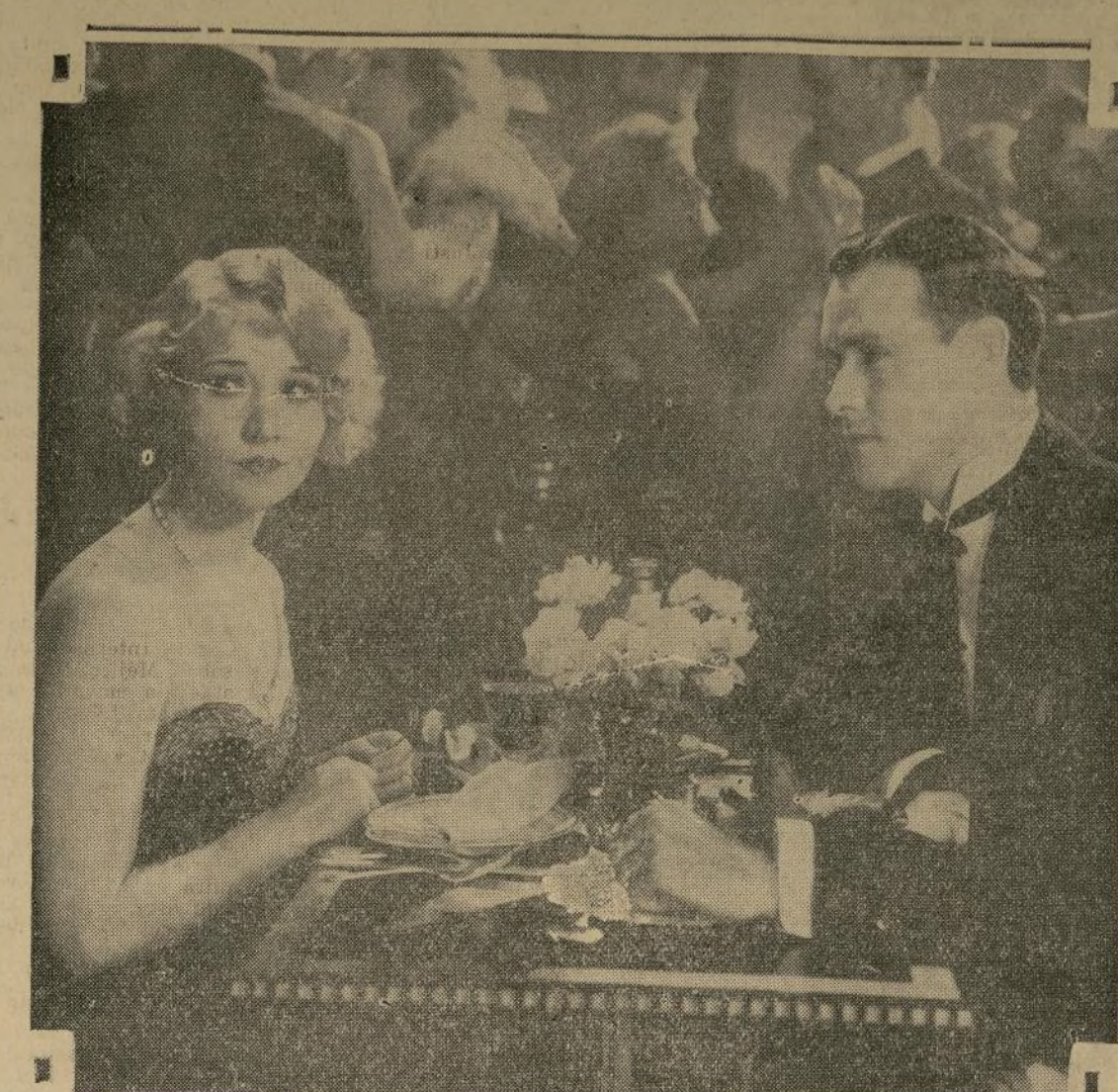
Las parejas no siempre marchan de acuerdo, y entre Betty Compson y John Harron debe haber surgido una desavenencia en esta escena de "The Czar of Broadway", que se exhibe al presente en el teatro "Roxy".

Yo propongo a George M. Cohan para la Galería de la Fama porque es el único comediante que conozco